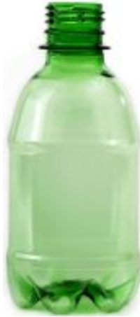
Garrafa do tipo PET com 250 ml de água

Sugestão de simulacro para treinamento e aplicação do teste: