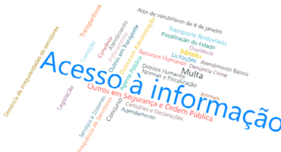
Imagem 01: Principais temas das interações do Fala.BR no período de 01/01/2022 a 24/04/2024, acesso em 24/04/2024.

Para fins de atribuição das notas no critério “mais solicitados em transparência ativa” foi realizada a contagem de repetições de palavras-chave para cada uma das interações do Fala.BR, plataforma integrada de ouvidoria e acesso à informação, mantido pela Controladoria-Geral da União (CGU), através de pedido de acesso à informação, elogio, reclamação, solicitação e sugestão: