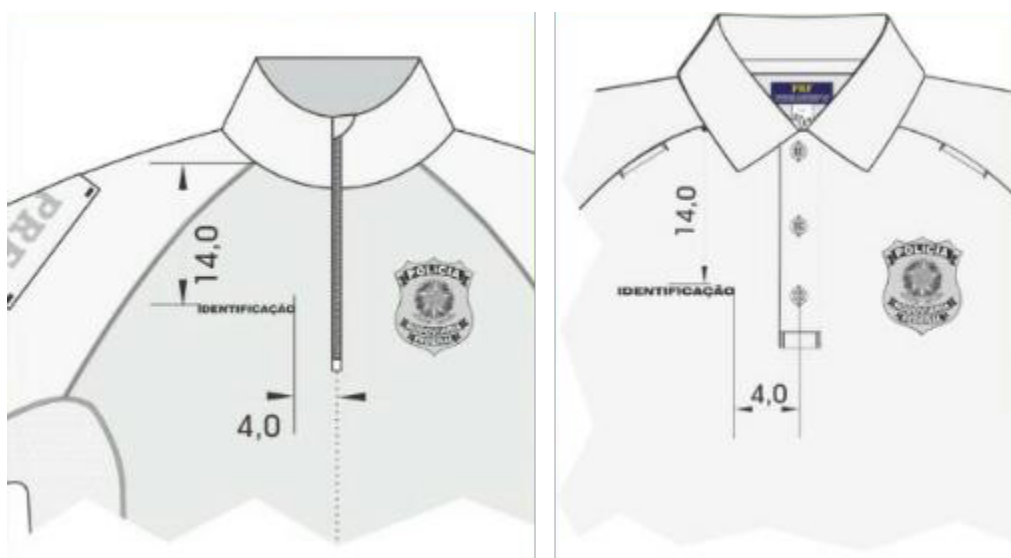
Figura 4. Posicionamento da ID-N por Filme/ Transfer ou Serigrafia/ Silk Screen .