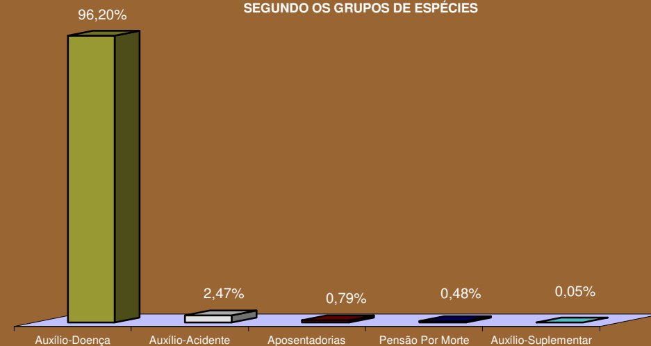
DISTRIBUIÇÃO DA QUANTIDADE DE BENEFÍCIOS ACIDENTÁRIOS CONCEDIDOS, SEGUNDO OS GRUPOS DE ESPÉCIES