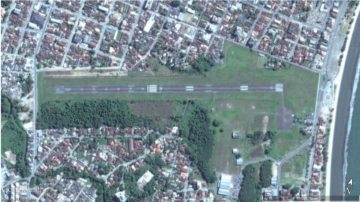
Figura 3 – Imagem via satélite do Aeroporto de Ubatuba Elaboração: LabTrans/UFSC (2018)

As unidades territoriais de planejamento (UTPs) delimitam uma área de captação direta e próxima ao aeródromo da região. O aeródromo de Ubatuba está localizado dentro da UTP de Caraguatatuba, a qual compreende três municípios, conforme mostra a Figura 4.