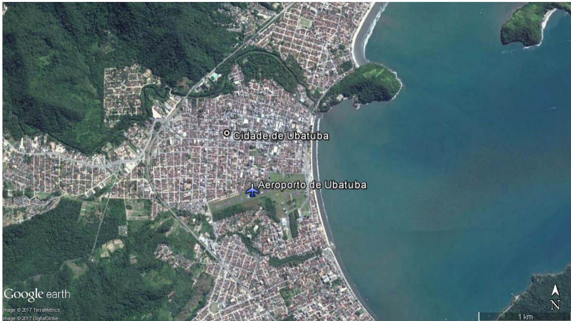
Figura 2 – Localização geográfica do Aeroporto de Ubatuba Elaboração: LabTrans/UFSC (2018)

O Aeroporto de Ubatuba (SDUB) localiza-se em município de mesmo nome, no estado de São Paulo, e apresenta uma distância de 1,5 quilômetros do centro da cidade. A Figura 2 representa a imagem de satélite do aeroporto e sua região de entorno.