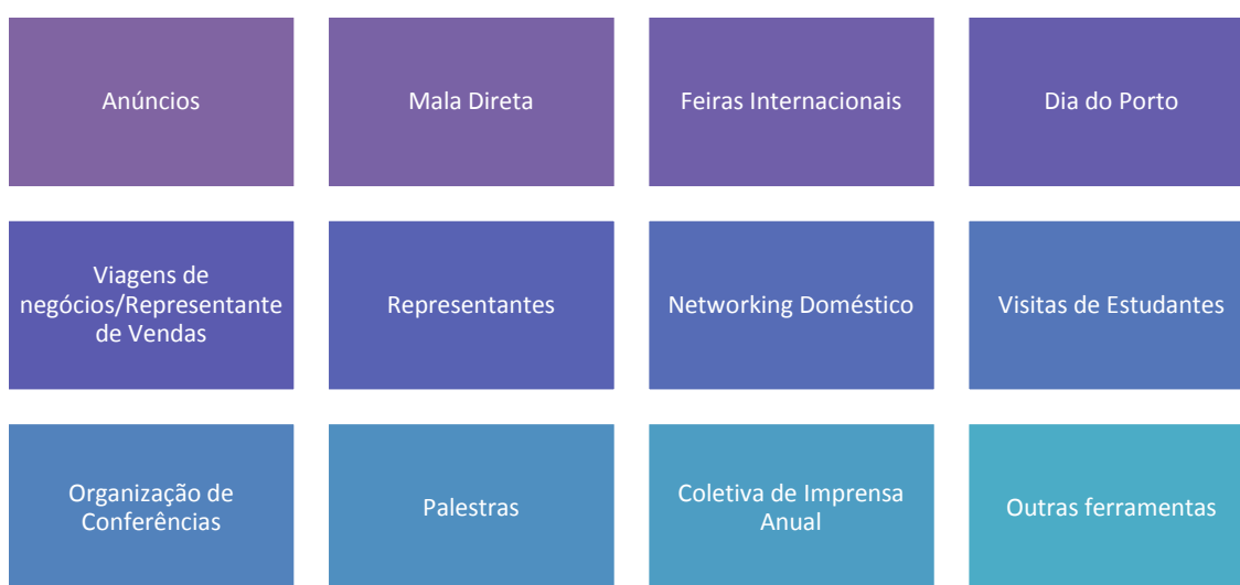
Figura 6 - Ferramentas de Promoção

O gestor de marketing poderá lançar mão de uma grande diversidade de ferramentas para traçar sua estratégia de aproximação, obtenção e retenção de clientes. Para obter um melhor relacionamento com a comunidade, a Autoridade Portuária poderá trabalhar em ações de alcance local, tal como visitas de escolas e patrocínios a projetos sociais/culturais da comunidade. Para alcançar mercados ainda não desenvolvidos, o envio de representantes pode estimular uma maior interação. Cada público e cada objetivo demandarão, portanto, ferramentas específicas.