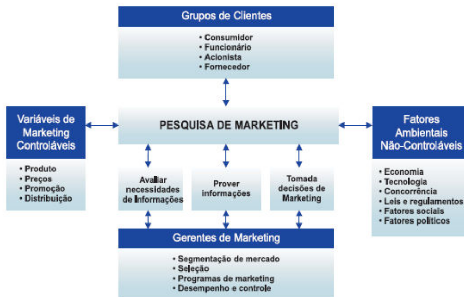
Figura 3 - Sistema de Pesquisa de Marketing

Independente da fonte de pesquisa escolhido, o ideal é que cada organização possua sua própria central de inteligência de marketing . Sua principal função será detectar ameaças, oportunidades e modificações no ambiente através dos mecanismos de coleta de dados, transformando-os em informações que possam ser facilmente compreendidas e distribuindo-as adequadamente pelos diversos departamentos.