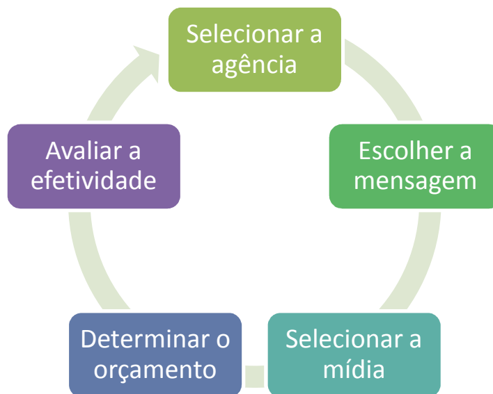
Figura 7 - Processo de Concepção de Anúncios

Atento a estes detalhes, o gestor de marketing poderá iniciar o processo de concepção dos anúncios, conforme descrito no esquema abaixo.