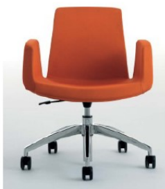
(Imagem meramente ilustrativa) MODELO DE REFERÊNCIA