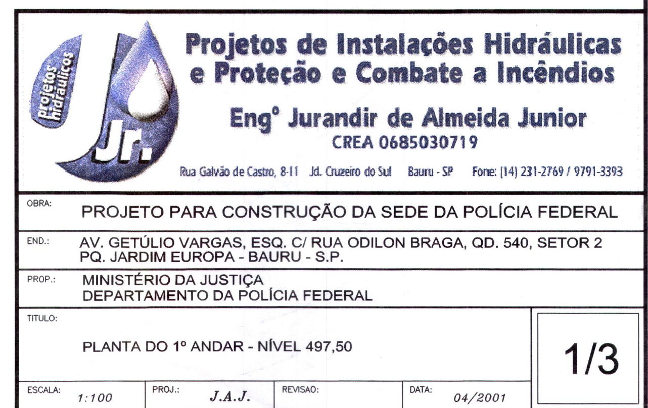
PLANTA DO 1º ANDAR - NÍVEL 497,50 ESCALA: 1:100