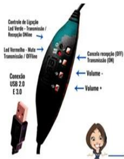
Figura 01: Controles de volumes + e - / mute/pausa