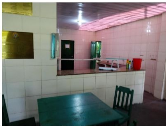
Figura 9: Cozinha do Refeitório