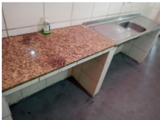
Figura 10: Bancada e pia