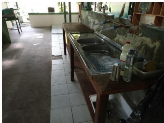
Figura 15: Pias da Cozinha