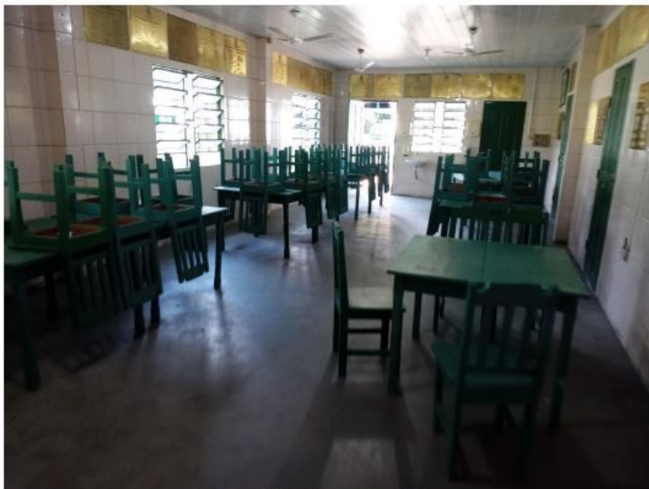
Figura 3: Refeitório, mesas e cadeiras