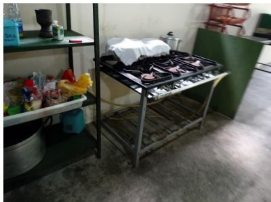
Figura 16: Fogão Industrial