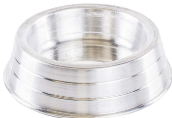
Item 6: Comedouro de metal (alumínio) tamanho M com canaleta para adição de água (anti-formiga) (imagem meramente ilustrativa).