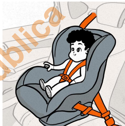
FIGURA 2: Cadeirinha