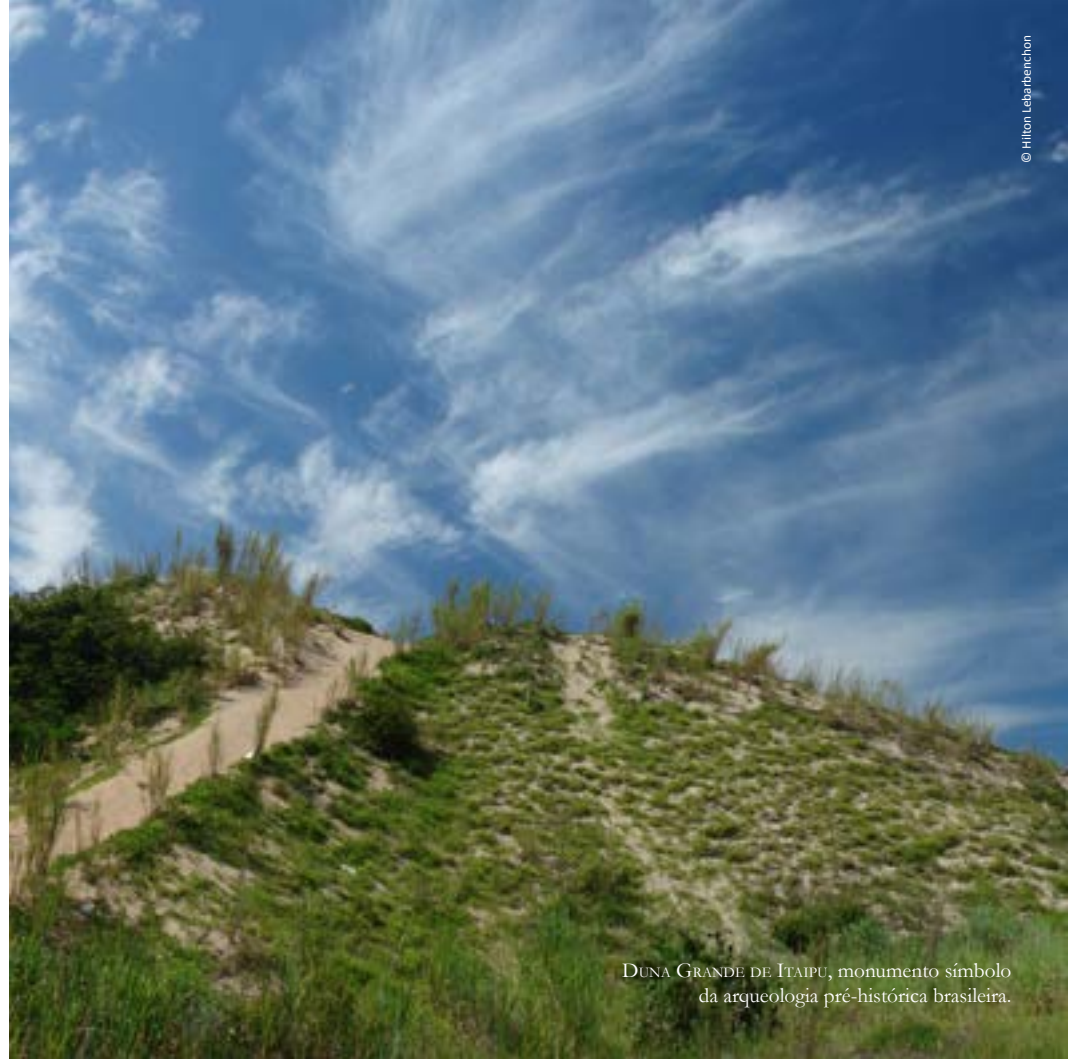
DUNA GRANDE DE ITAIPU, monumento símbolo da arqueologia pré-histórica brasileira.

Entre eles estavam os nossos povos sambaquieiros, presentes no litoral brasileiro (como comprova o sítio arqueológico Duna Grande na praia de Itaipu) há pelo menos oito mil anos! Os pesquisadores acreditam que os humanos possam ter construído sambaquis ainda mais antigos, mas a ausência de vestígios arqueológicos que ultrapassem quinze mil anos provavelmente decorre da dinâmica das feições litorâneas. Ou seja, alguns sambaquis podem estar submersos, em vir-