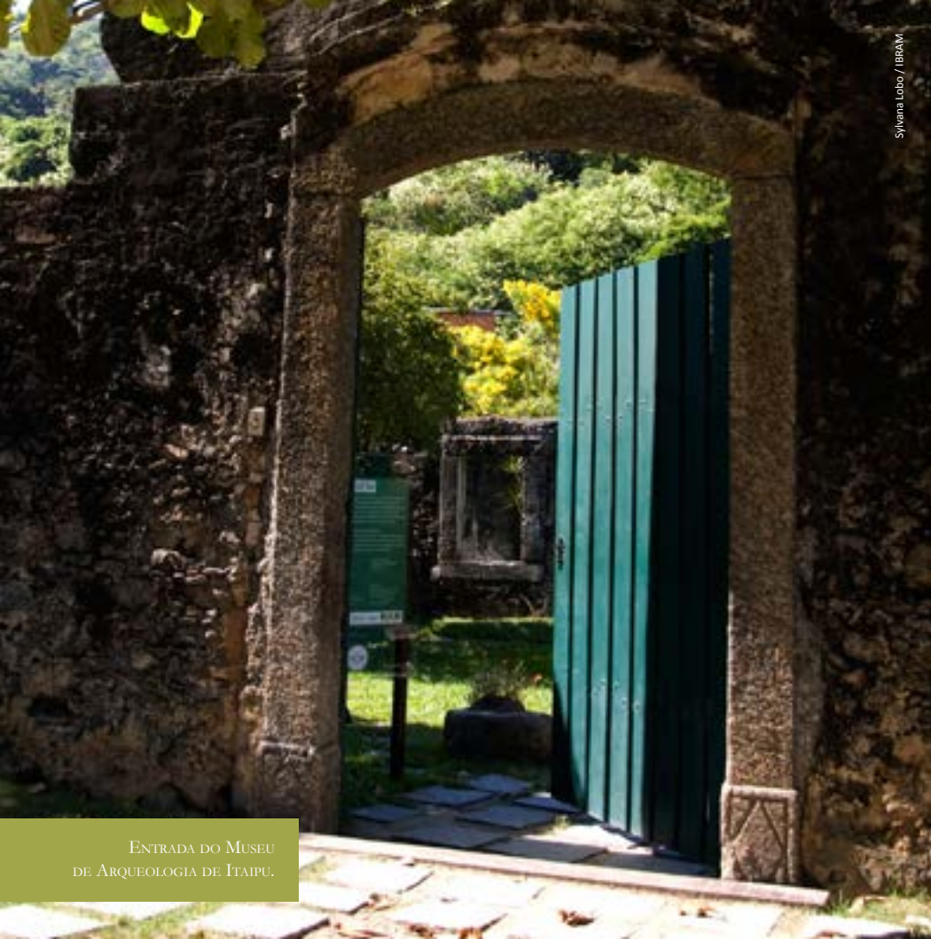
ENTRADA DO MUSEU DE ARQUEOLOGIA DE ITAIPU.