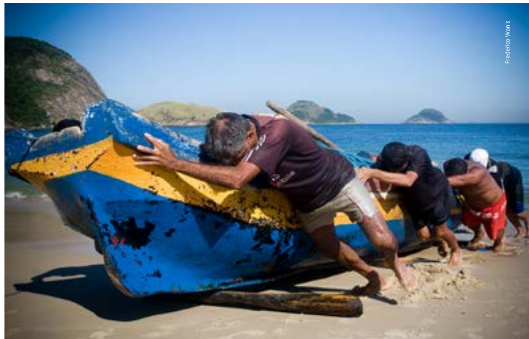
PESCA EM ITAIPU. Passaram-se os séculos e a presença do mar ditou a atividade principal da região.

Construído em um local ermo, cercado pelo mar e pela serra coberta de Mata Atlântica, o recolhimento parece ter sido um local de encarceramento de mulheres consideradas “deslocadas” ou “marginais” na sociedade patriarcal do período colonial.