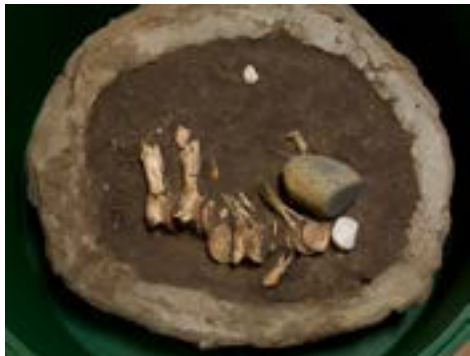
DETALHE DA SUPERFÍCIE DO SÍTIO DUNA GRANDE.