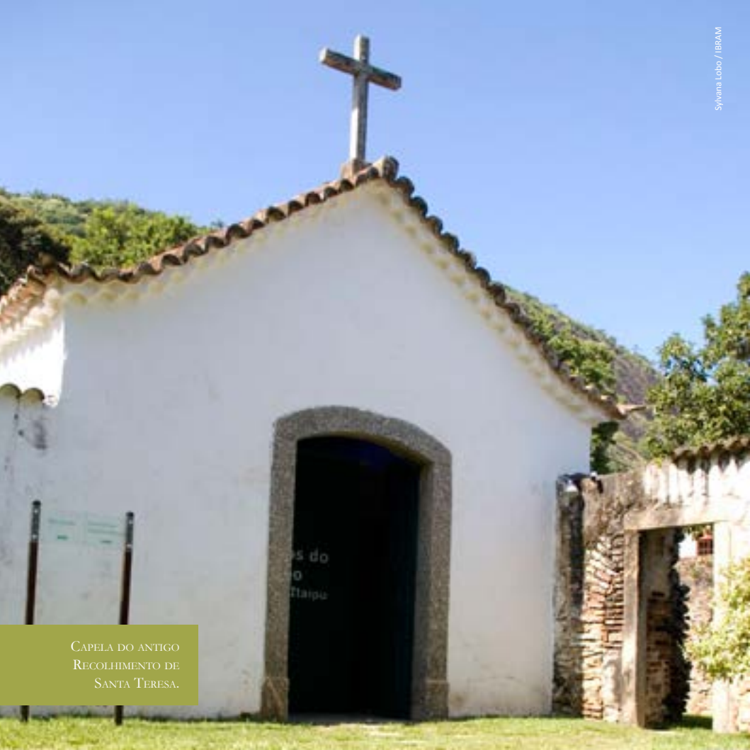
CAPELA DO ANTIGO RECOLHIMENTO DE SANTA TERESA.