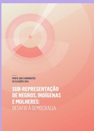
Perfil dos candidatos às eleições 2014 – Sub-representação de negros, indígenas e mulheres: desafio à democracia