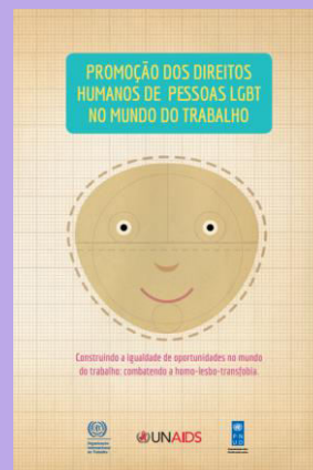
Construindo a igualdade de oportunidades no mundo do trabalho: combatendo a homo-lesbo-transfobia