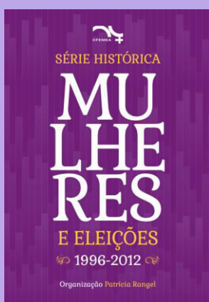
Série Histórica Mulheres e Eleições 1996-2012

Clique no box para acessar o conteúdo completo