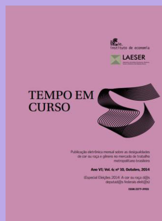
Tempo em Curso – LAESER – Outubro: A cor ou raça d@s deputad@s federais eleit@s