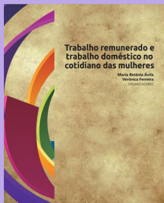
Trabalho remunerado e trabalho doméstico no cotidiano das mulheres