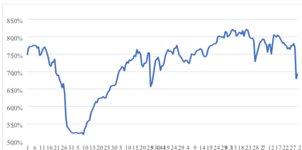
Fator de utilização global das refinarias do sistema Petrobras

Fator de utilização do parque de refino - março, Abril, Maio, Junho, Julho, Agosto, Setembro e Outubro/2020