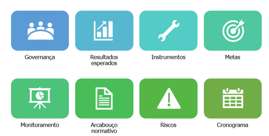
Figura 3. Estruturação do PRR: elementos centrais que devem nortear a implementação.

Assim, resgatando que o PRR tem como principal objetivo reduzir assimetria de informação e promover a participação efetiva de todas as entidades setoriais usuárias da água no território brasileiro nas discussões e implementação das ações propostas no Plano, bem como da sociedade em geral, é imprescindível adotar padrões para condução das atividades, para melhorar a compreensão destas e a avaliação de sua eficácia e eficiência. Dessa forma, a Figura 3 traz os elementos centrais que devem nortear a estruturação do PRR, que serão abordados com maior profundidade nos itens seguintes.