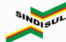
Sindicato das Empresas Distribuidoras de Combustíveis do Estado do Rio Grande do Sul