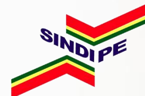
Sindicato dos Distribuidores de Combustíveis do Estado de Pernambuco