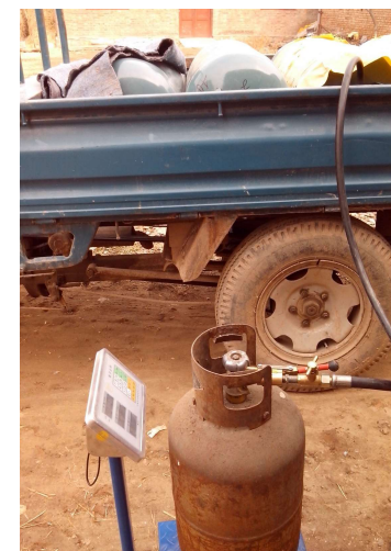
Sistema em uso China