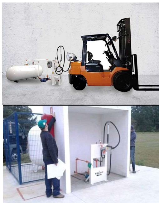
Sistema em uso no Brasil