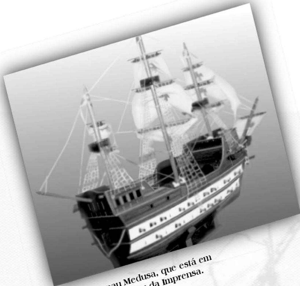
Réplica da nau Medusa, que está em exposição no Museu da Imprensa.

...os primeiros prelos da Impressão Régia vieram nos porões da nau Medusa, quando da transferência da Corte Portuguesa para o Brasil, trazendo à colônia inestimáveis benefícios, dentre os quais, a criação de uma Imprensa Oficial?