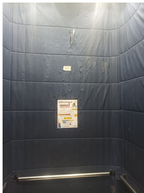
Imagem 2 - elevador cap. 16 pessoas

2.2 A troca das capas é visualmente necessária, e justifica-se devido: