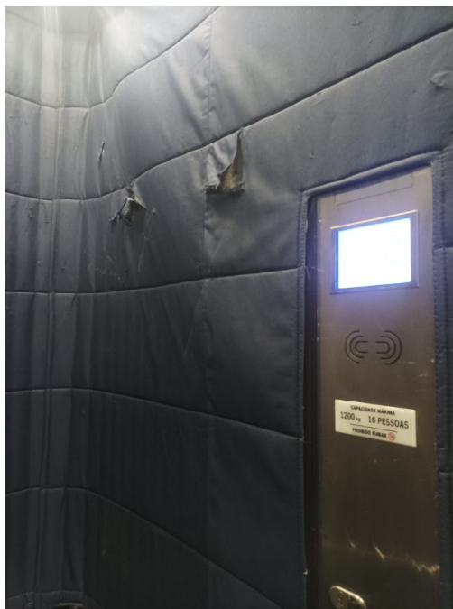
Imagem 1 - elevador cap. 16 pessoas

2.1.1. As imagens abaixo, demonstram a necessidade da substituição: