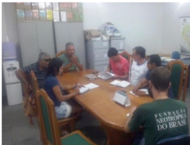
Figura 1 – Reunião com representantes do Conselho Municipal de Meio Ambiente (COMDEMA) de Bodoquena MS, relatando sobre o projeto a ser desenvolvido.