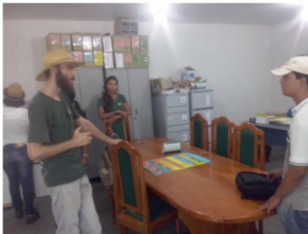
Figura 2 – Reunião, após visita técnica no Assentamento Canaã e outras áreas rurais do município de Bodoquena MS, realizada em conjunto com a equipe da Secretaria de Meio Ambiente de Bodoquena.