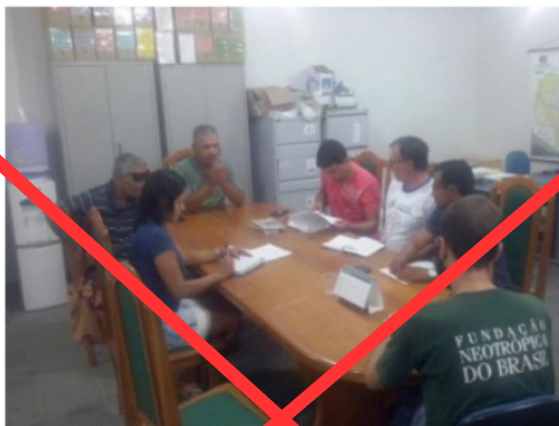
Figura 1 – Reunião com representantes do Conselho Municipal de Meio Ambiente (COMDEMA) de Bodoquena MS, relatando sobre o projeto a ser desenvolvido.