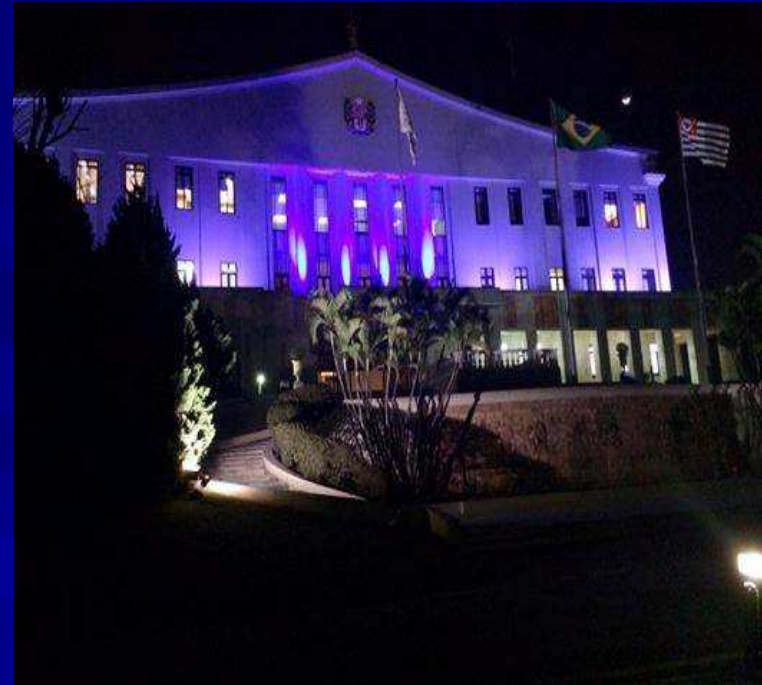
Palácio das Bandeiras iluminado de azul

Iluminação do Palácio da Bandeiras de azul.