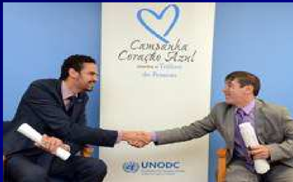
Secretário Nacional de Justiça, Paulo Abrão e o Representante do Escritório da UNODC, Rafael Franzini

Lançamento do “Atlas da Feira Nacional de Práticas de Enfrentamento ao Tráfico de Pessoas e Experiências de Políticas Migratórias e Refúgio” e do “1º Relatório Semestral de Atividades da Rede de Núcleos e Postos de Enfrentamento ao Tráfico de Pessoas”, em parceria com o Escritório das Nações Unidas sobre Drogas e Crimes do Cone Sul (UNODC), realizado no dia 31 de julho de 2014, às 14h, no Escritório da UNODC.