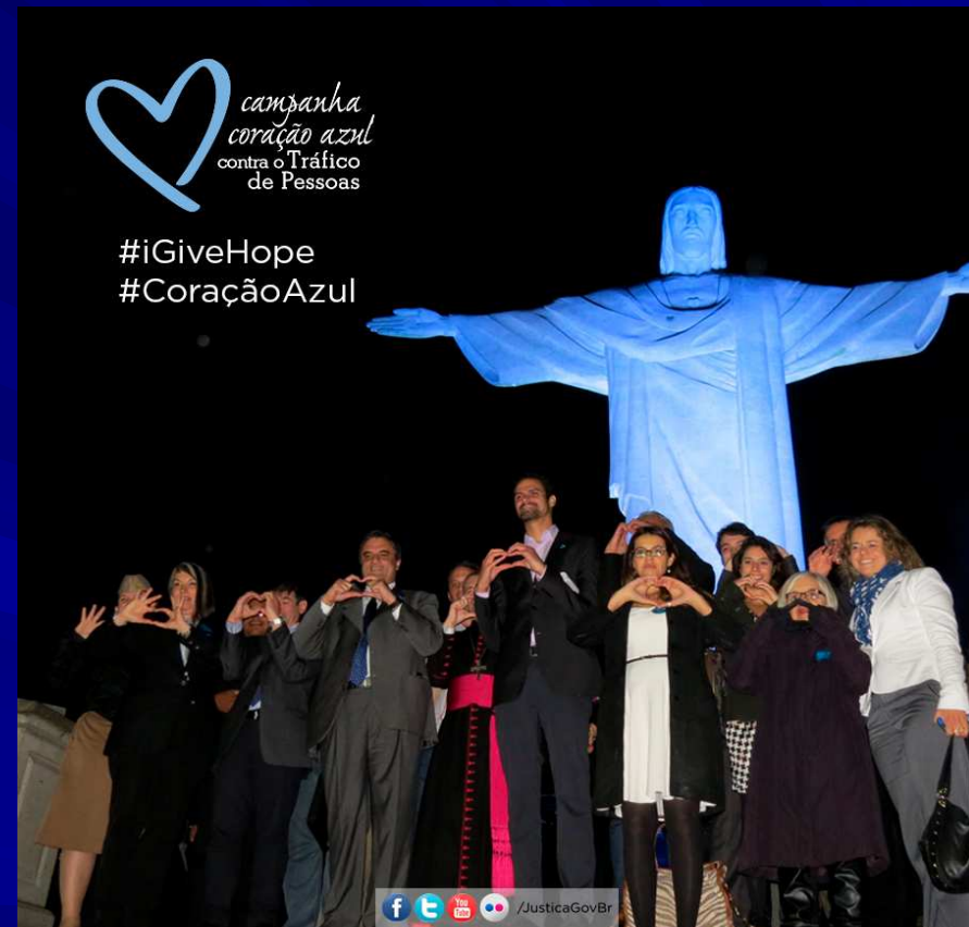
Cristo Redentor iluminado de azul, José Eduardo Cardozo (Ministro da Justiça), Paulo Abrão (Secretário Nacional de Justiça) e sua equipe de Enfrentamento ao Tráfico de Pessoas

O Cristo Redentor foi o primeiro monumento a receber a iluminação especial de azul em homenagem à Campanha Coração Azul na noite do dia 28 de julho de 2014 (segunda-feira), quando foi palco da abertura da Semana Nacional de Mobilização pelo Enfrentamento ao Tráfico de Pessoas e apresentação do Relatório Nacional de Dados de Tráfico de Pessoas de Pessoas - Dados de 2012, no Corcovado, Rio de Janeiro/RJ.