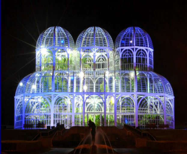
O Palácio Iguçu e a estufa do Jardim Botânico colorido de azul

Divulgação no jornal da Ordem dos Advogados/ PR - 28/07/14 - Curitiba.