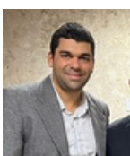
SÉRGIO EDUARDO CORREA VIDIGAL DIRETOR-GERAL DO INSTITUTO DE PESOS E MEDIDAS DO ESTADO DO ESPÍRITO SANTO - IPEM