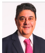
WADIH DAMOUS SECRETÁRIO NACIONAL DO CONSUMIDOR