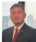
ALEXANDRE SHIOZAKI COORDENADOR-GERAL DO SINDEC SENACON