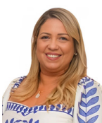
LETÍCIA COELHO NOGUEIRA DIRETORA-GERAL DO PROCON ESPÍRITO SANTO