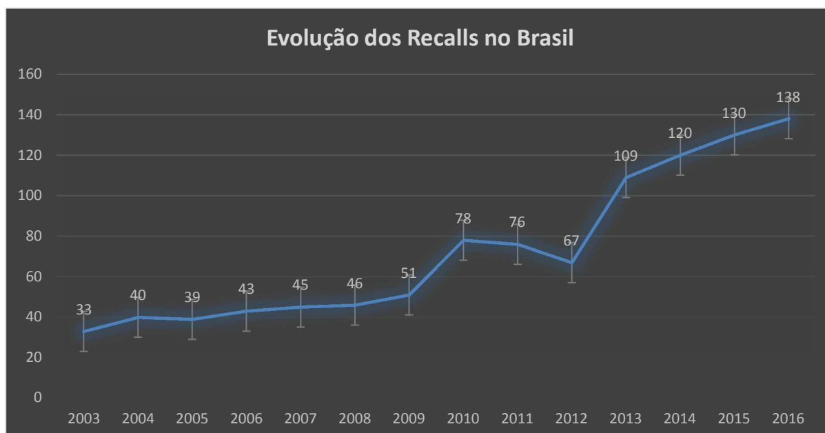
Gráfico 1. Evolução dos procedimentos de recall no Brasil. 2003-2016.

No ano de 2016 , foram realizados no Brasil 138 recalls .