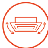
Controle Independente das Aletas