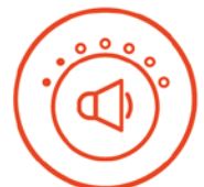
Baixo Nível de Ruído