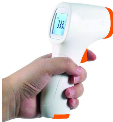
Figura meramente ilustrativa