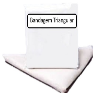
Figura meramente ilustrativa

19.3.13.1. Bandagem formato triangular em algodão crú lavável. Deverá ser entregue em embalagem individual com abertura asséptica e conter na embalagem dados de identificação do produto. Devem ter as medidas aproximadas (1,40 x 1,00 x 1,00). A bandagem triangular é multifuncional e indispensável tanto nos ambientes hospitalares quanto em atendimento Pré-hospitalar. Acessório com múltiplas funções, utilizado no resgate a vítimas, podendo ser empregada em diferentes partes do corpo para imobilizações provisórias, muito utilizada como tipoia. Tamanho utilizado em vítimas de pequena estatura.