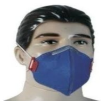
Figura meramente ilustrativa

19.3.25.1. Máscara purificador de ar de segurança, não estéril, com filtro eficiente para retenção de contaminantes presentes na atmosfera sob a forma de aerossóis, classe PFF2 (s), sem válvula de exalação; fabricada em não tecido, atóxica e apirogênica, com 02 (duas) tiras de elástico sobre presilhas plásticas onde é possível ajustar a pressão do respirador sobre o rosto, e um clip metálico para selagem sobre o septo nasal. Deve apresentar CA. Caixa contendo 50 unidades.