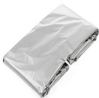
Figura meramente ilustrativa

alumínio. Deve ser certificado pelo INMETRO.