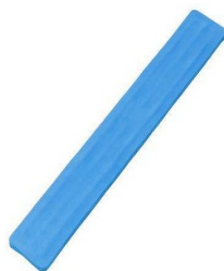
Figura meramente ilustrativa

19.3.34.1. Tala para imobilização de membros, confeccionada em tela aramada, maleável, galvanizada, coberta com EVA (4mm) – colorido para identificar o seu tamanho P, tamanho aproximado de 53 x 08 cm cm.