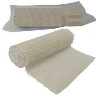
Figura meramente ilustrativa