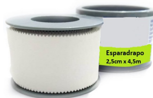
Figura meramente ilustrativa

19.3.18.1. Esparadrapo transparente (tipo transpore) com ótima adesão, no tamanho 2,5cm x 4,5m, corte reto, confeccionado em polietileno micro-perfurado, com adesivo acrílico hipoalergênico, enrolado em carretel e proteção de plástico. Deve conter o registro da Agência Nacional de Vigilância Sanitária - ANVISA e certificação do INMETRO. Utilizado no auxílio da fixação de pequenos curativos com aplicação de gaze estéril e/ou na finalização de imobilização por material do tipo ataduras.