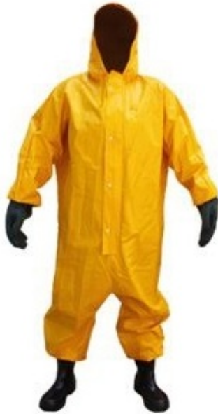
Figura meramente ilustrativa