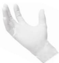
Figura meramente ilustrativa

19.3.20.1. Luva para procedimentos não cirúrgicos, produzida em material látex de alta qualidade e coloração natural, aplicação de talco/pó absorvível. Produto deve estar cadastrado na Anvisa e apresentar certificado de liberação do INMETRO e Certificado de Aprovação - CA contra agentes biológicos. Caixa com 100 unidades.