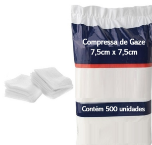
Figura meramente ilustrativa

19.3.15.1. Pacote com 500 unidades de compressa de gaze não estéril confeccionada com fios 100% algodão em tecido tipo tela, com 8 camadas e 5 dobras proporcionando maior absorção de fluidos e retenção de líquidos, na cor branca, macia, isenta de impurezas, com dimensão de 7,5cm x 7,5cm quando fechadas e 7,5cm x 30cm quando abertas. Material deve atender a certificação do INMETRO. Utilizado na aplicação de material asséptico e desinfecção de equipamentos como macas, pranchas e entre outros devido sua característica não estéril.