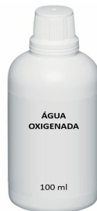
Figura meramente ilustrativa

19.3.1.1. Antisséptico 10 volumes com ação germicida, de aplicação local, para uso adulto e pediátrico.