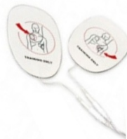
Figura meramente ilustrativa

19.3.38.1. Jogo de eletrodos contendo (02) duas pás de uso adulto para Desfibrilador Externo Automático - DEA, modelo compatível com a aquisição especificada neste instrumento, com garantia e certificado de aprovação do INMETRO.