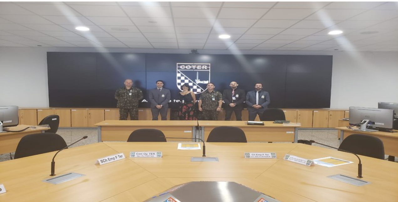
Figura 8: Visita ao Comando de Operações Terrestre (COTER) do Exército Brasileiro (EB).