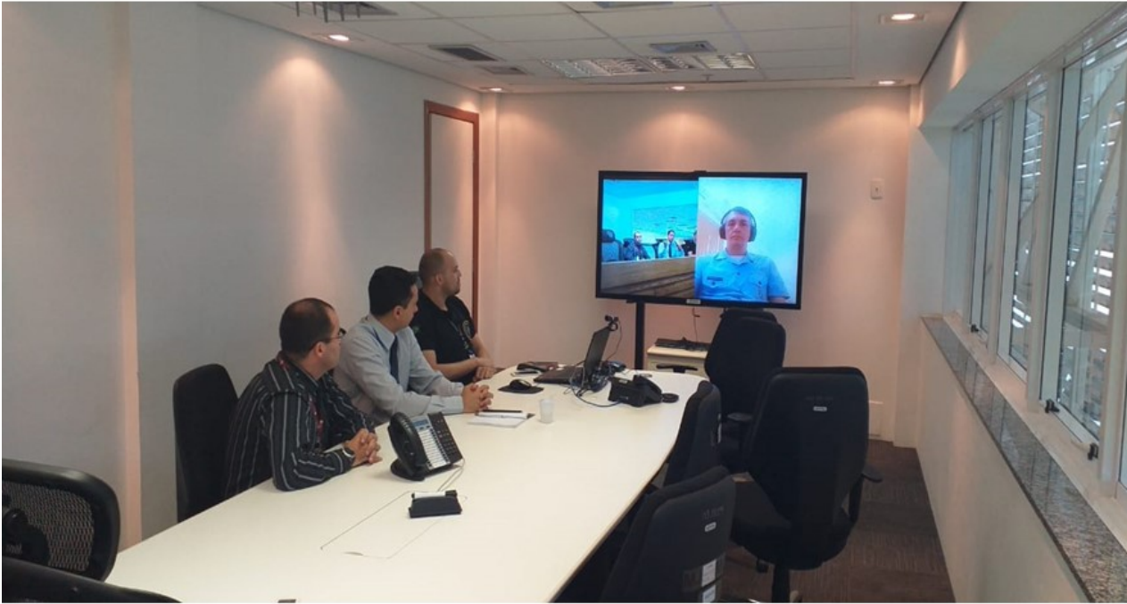
Figura 3: Vídeo conferência com o Coronel Aviador Paulo Sergio Porto (FAB).