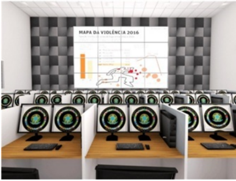
Fig. 2: Vídeo Wall 2x4 / Sala de Situação e de Vídeo Monitoramento