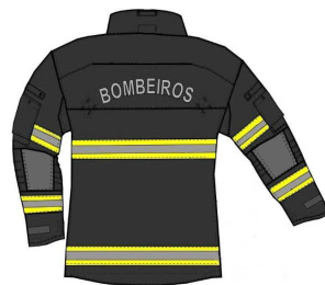
Fig. 2 - vista dorsal do casaco de proteção e alça de salvamento