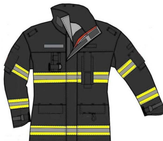
Fig. 1 - Vista frontal do casaco de proteção