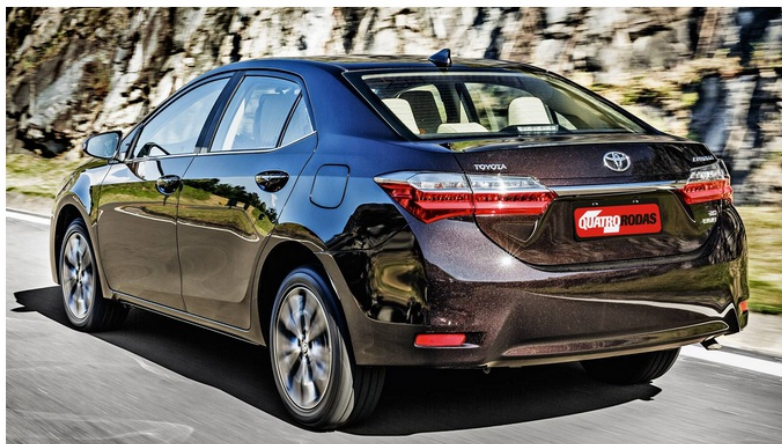
Reestilização atualizou o visual do Corolla

Quem compra sabe o que encontrará: um carro confortável, robusto e bom de dirigir. O Prius simboliza o futuro da Toyota. E não apenas por ser ecologicamente correto: a quarta geração estreou a plataforma TNGA, que será utilizada em metade dos novos modelos da marca no mundo até 2020.