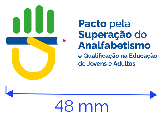
REDUÇÃO MÁXIMA Mídia Impressa

Em meios eletrônicos, a redução máxima é de 160 px (versão preferencial) e nas versões secundárias - uso específico, vide ao lado.