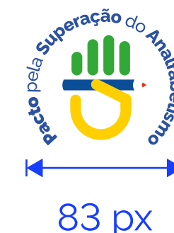
REDUÇÃO MÁXIMA Mídia Eletrônica