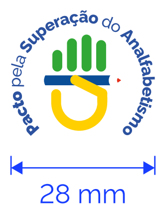
REDUÇÃO MÁXIMA Mídia Impressa