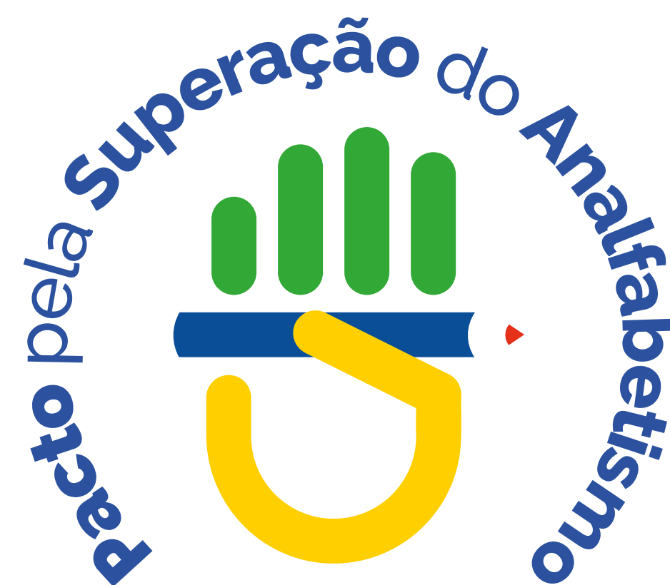
VERSÃO SECUNDÁRIA (uso específico)