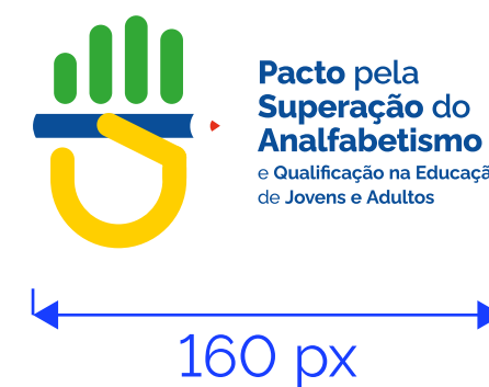
REDUÇÃO MÁXIMA Mídia Eletrônica