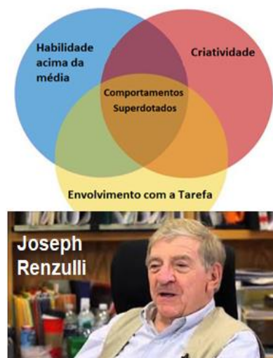
Imagem ilustrando a Teoria dos Três Anéis, com a foto de Joseph Renzulli