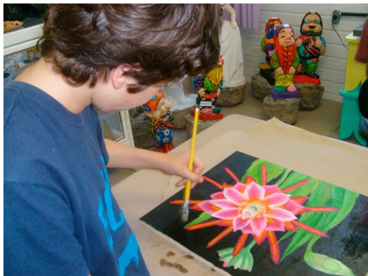
Núcleo de Atividades de Altas Habilidades– Superdotação (Naah-s) de Santa Catarina, em São José, município da região metropolitana de Florianópolis http://portal.mec.gov.br/component/tags/tag/32300

As ações pedagógicas do serviço de atendimento educacional especializado para estudantes com altas habilidades ou superdotação, regulamentadas pelos sistemas de ensino, visam ao desenvolvimento de habilidades cognitivas, socioafetivas, psicomotoras, comunicacionais, linguísticas, identitárias e culturais dos estudantes da educação especial. O atendimento educacional especializado para estudantes com altas habilidades ou superdotação independe de idade, nível ou etapa de ensino, deve ser oferecido transversalmente da educação infantil à educação superior.