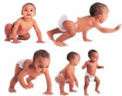
Imagem ilustrando o desenvolvimento infantil na fase psicomotora do sentar-se ao andar sem apoio.

IX - Notificação e Orientação aos Pais: Ao final do processo de identificação dos estudantes com altas habilidades ou superdotação, os pais ou responsáveis deverão ser notificados e convidados a comparecer à primeira reunião com a família para tomarem conhecimento acerca do programa de atendimento educacional especializado aos estudantes com altas habilidades ou superdotação, estabelecido pelos sistemas de ensino estaduais, municipais e do Distrito Federal. As informações sobre o programa, seus objetivos e metas, o plano de ensino individualizado, as atividades desenvolvidas, a forma de avaliação dos produtos deve estar de acordo com as diretrizes estabelecidas pelos sistemas de ensino.