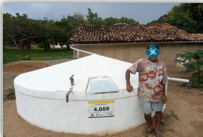
Foto 2 – Visualização do Sistema de Descarte, Filtro de Barro, Calha, Telhado e