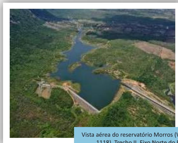
Vista aérea do reservatório Morros (WBS 1118), Trecho II, Eixo Norte do PISF.