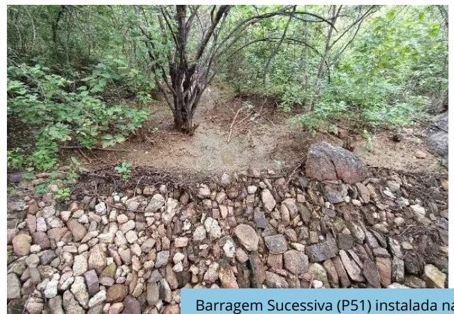
Barragem Sucessiva (P51) instalada na UD da VPR Salão, Trecho V, Eixo Leste do PISF.