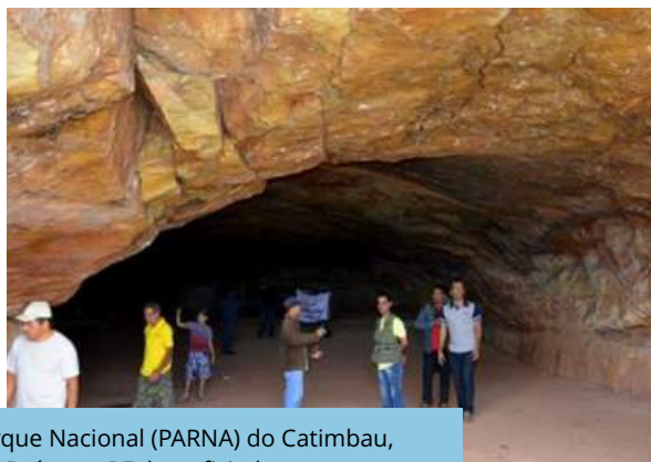
Parque Nacional (PARNA) do Catimbau, em Buíque - PE, beneficiado com aplicação de recursos oriundos da compensação ambiental do PISF.

Ministério da Integração e do Desenvolvimento Regional