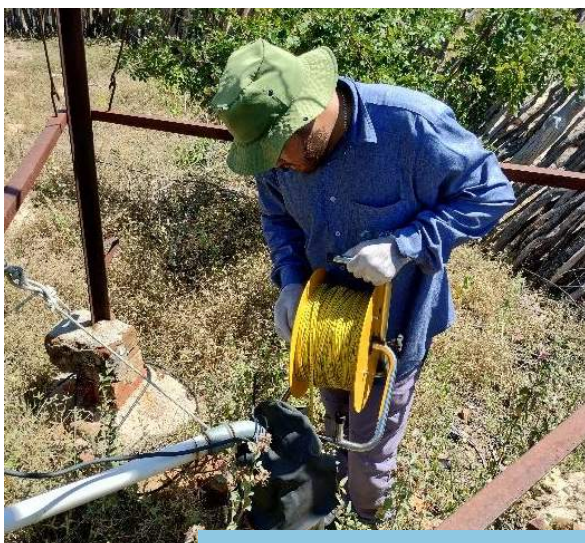
Mensuração do nível estático do ponto amostral P33, município de Floresta – PE (Eixo Leste).

Consórcio Gestor Ambiental (Execução/Acompanhamento) Universidade Federal do Pernambuco – UFPE (Execução)