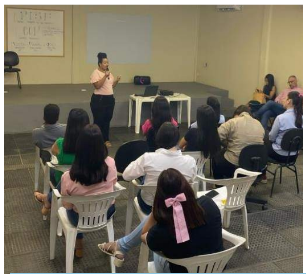
Treinamento sobre “Direção Defensiva”, realizado no auditório do canteiro de Sertânia/PE.