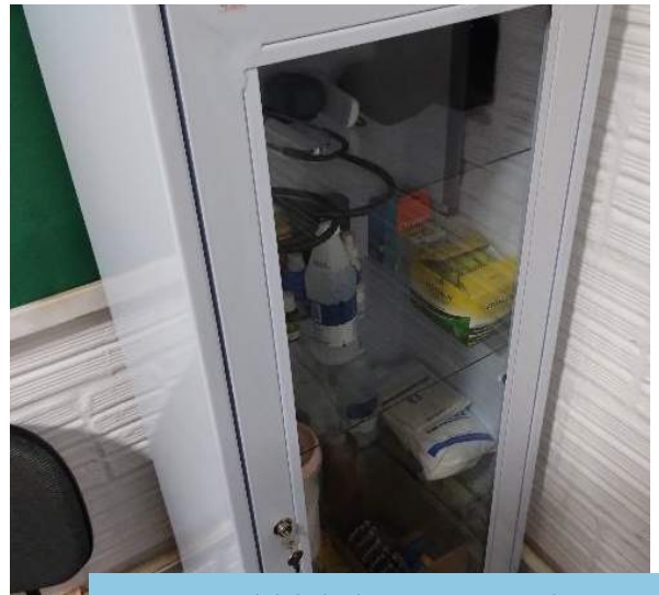
Disponibilidade de materiais e medicamentos no ambulatório do canteiro de Uri (Salgueiro/PE), Trecho I, Eixo Norte do PISF.