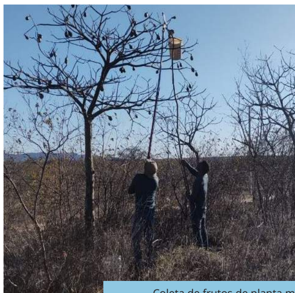
Coleta de frutos de planta matriz de Pseudobombax marginatum , no município de Salgueiro (PE).