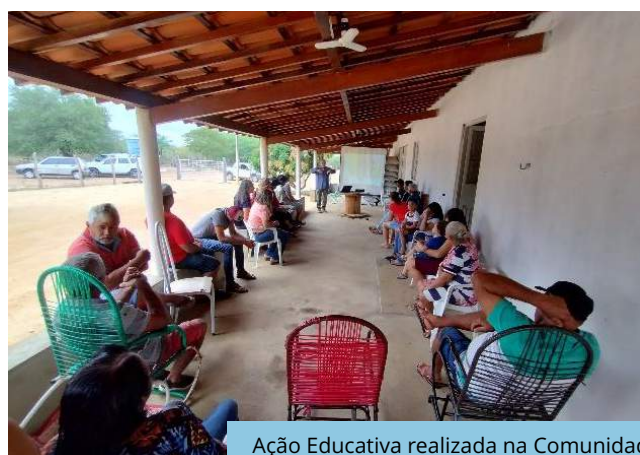
Ação Educativa realizada na Comunidade Maria Preta (Cabrobó/PE).