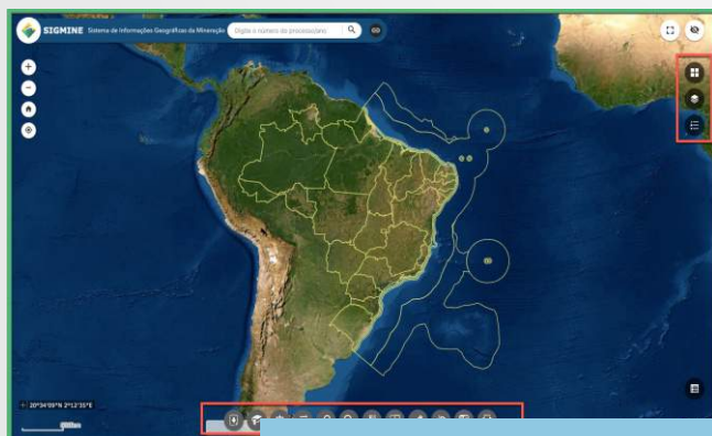
Sistema de Informações Geográficas da Mineração SIGMINE da ANM.

Este Programa tem por objetivo geral a liberação da faixa correspondente à Área Diretamente Afetada (ADA), solucionando as possíveis interferências ou impactos negativos resultantes da construção e operação do empreendimento, sobre as áreas de interesse extrativo mineral, as áreas de exploração mineral requeridas e sobre as que estiverem em diferentes estágios de licenciamento. Tais impactos estão ligados a eventuais restrições ou impedimentos operacionais que dificultem ou impeçam o prosseguimento da atividade exploratória, ou provoquem limitações na definição do real potencial mineral da área requerida.