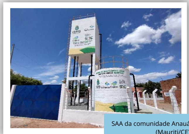
SAA da comunidade Anauá, (Mauriti/CE).