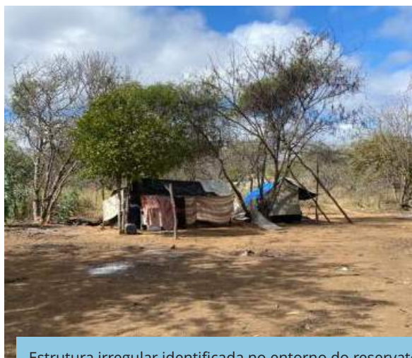
Estrutura irregular identificada no entorno do reservatório Muquém (WBS 2108), Floresta – PE.

PROCESSOS REFERENTES ÀS AÇÕES DE DESAPROPRIAÇÕES