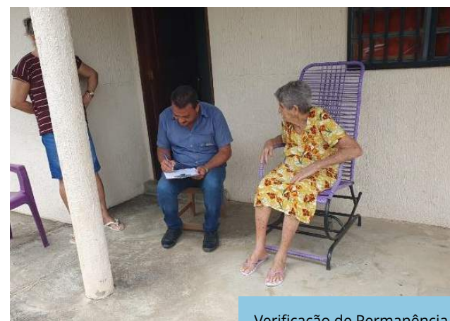
Verificação de Permanência na VPR Irapuá 2.