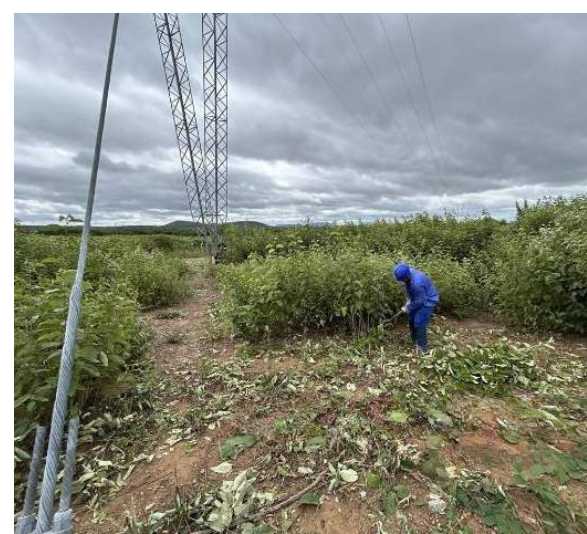
Rebaixamento da cobertura vegetal na base da Torre 24/1, trecho da LT entre SE-04 e SE-05, Trecho V, Leste do PISF.