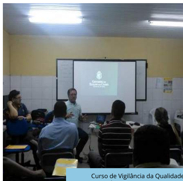
Curso de Vigilância da Qualidade da Água para Consumo Humano (VIGIÁGUA) em Brejo Santo - CE.

Ministério da Integração do Desenvolvimento Regional