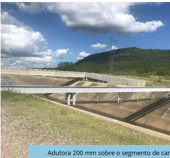
Adutora 200 mm sobre o segmento de canal WBS 1214, Trecho I, Eixo Norte do PISF.

Operadoras (Execução) Consórcio Gestor Ambiental (Acompanhamento)