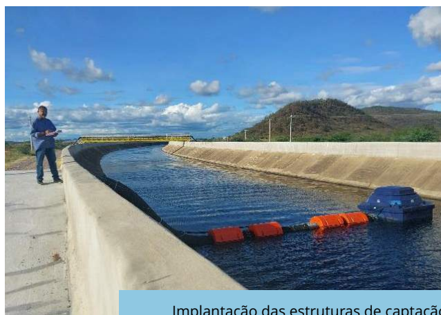
Implantação das estruturas de captação e adução de água do sistema de irrigação da VPR Baixio dos Grandes.