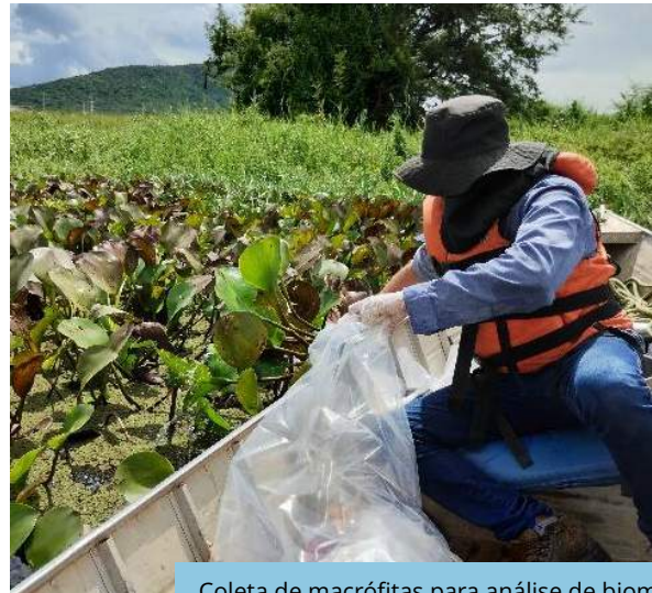
Coleta de macrófitas para análise de biomassa, na estação amostral Q85, Rio São Francisco (Eixo Norte).