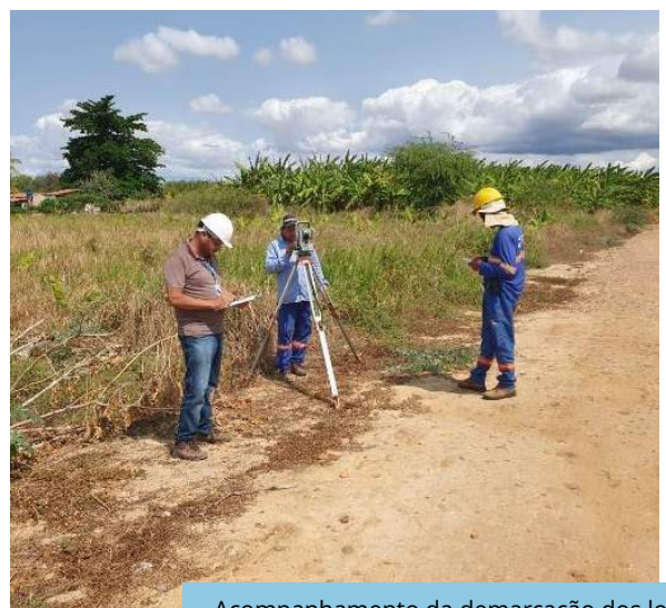
Acompanhamento da demarcação dos lotes irrigados no território indígena Truká (Cabrobó - PE).