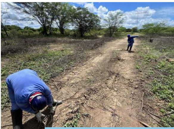
Limpeza na faixa de servidão da linha de transmissão do Eixo Leste com a cobertura vegetal removida.

Operadoras das LTs do PISF (Execução) Consórcio Gestor Ambiental (Execução e Acompanhamento)