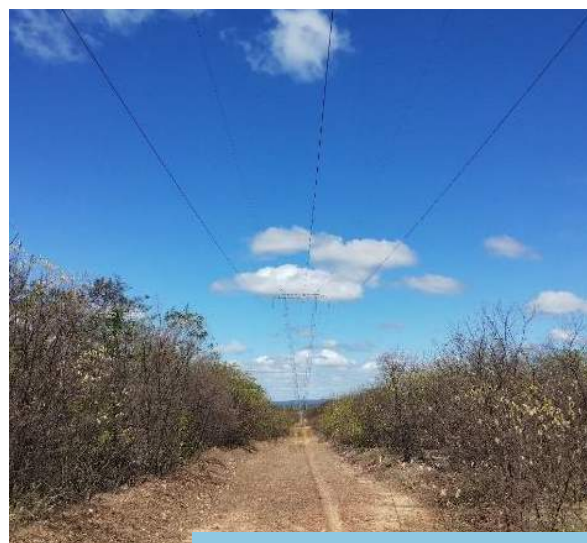
Acompanhamento da situação em trecho da LT, próximo ao segmento de canal WBS 1214, Trecho I, Eixo Norte do PISF.