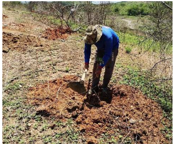
Plantio de mudas em núcleo de aceleração de regeneração natural, implantado pela Univasf, em área degradada do segmento de canal WBS 1241, Trecho II, Eixo Norte do PISF.