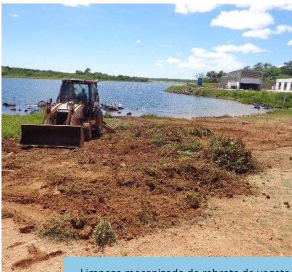
Limpeza mecanizada de rebrota de vegetação na bacia hidráulica do reservatório Moxotó, Trecho V, Eixo Leste do PISF.

O Programa inclui medidas de controle e monitoramento das atividades desenvolvidas na Área Diretamente Afetada pela implantação das obras civis, cujas ações estão direcionadas à garantia da qualidade da água dos reservatórios a serem implantados e à minimização das áreas de supressão de vegetação na faixa de domínio do PISF.