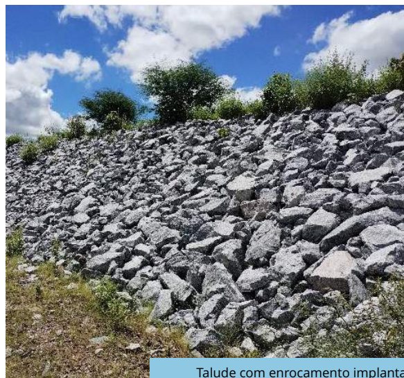
Talude com enrocamento implantado no segmento de canal WBS 2205, Trecho V, Eixo Leste do PISF.

Operadoras (Execução) Consórcio Gestor Ambiental (Execução e Acompanhamento)