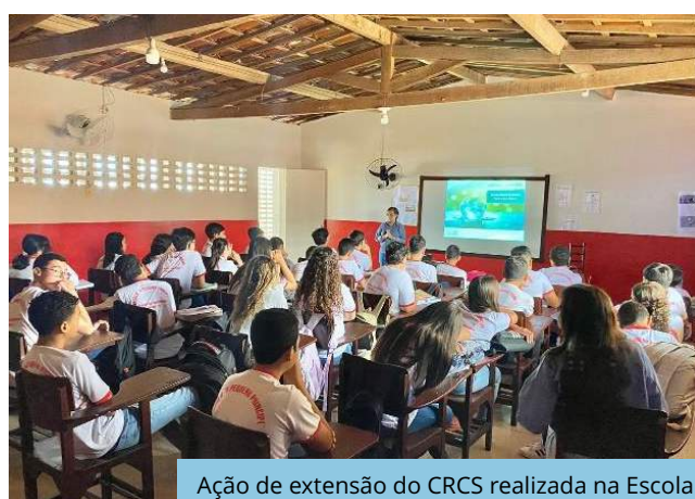
Ação de extensão do CRCS realizada na Escola O Pequeno Príncipe (Sertânia/PE), Trecho V, Eixo Leste do PISF.