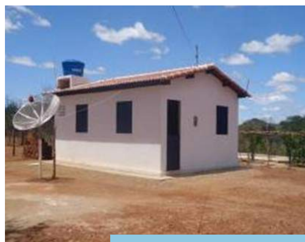
Construção de casas de alvenaria em substituição às de taipa, nas comunidades quilombolas.