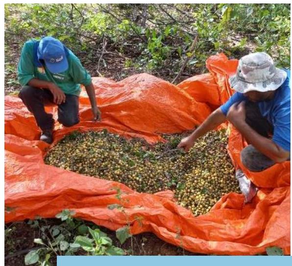
Coleta de frutos de Sarcomphalus joazeiro (Mart.) Hauenschild (juazeiro), na VPR Salão para a produção de mudas, Trecho V, Eixo Leste do PISF.