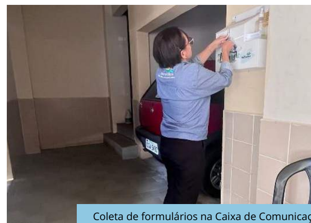
Coleta de formulários na Caixa de Comunicação instalada no Sindicato dos Trabalhadores Rurais de Monteiro/PB, Trecho V, Eixo Leste do PISF.