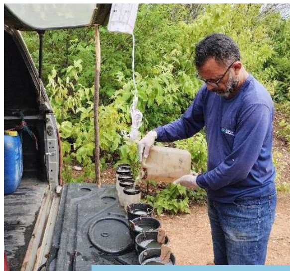
Preparação de armadilhas Ovitrap tipos 1 e 2, no reservatório Milagres (Eixo Norte).

Operadoras (Execução) Consórcio Gestor Ambiental (Execução/Acompanhamento) Universidade Federal Rural do Pernambuco - UFRPE (Execução)