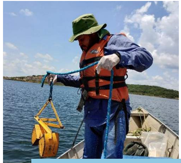
Coleta de sedimentos e zoobentos de fundo utilizando a draga de Petersen, na estação amostral Q17, Reservatório Cipó (Eixo Norte).