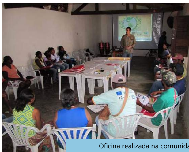
Oficina realizada na comunidade quilombola Conceição das Crioulas (Salgueiro - PE).

Fundação Nacional de Saúde - FUNASA, Secretaria de Desenvolvimento Agrário de Pernambuco - SDA (Execução) Consórcio Gestor Ambiental (Acompanhamento)