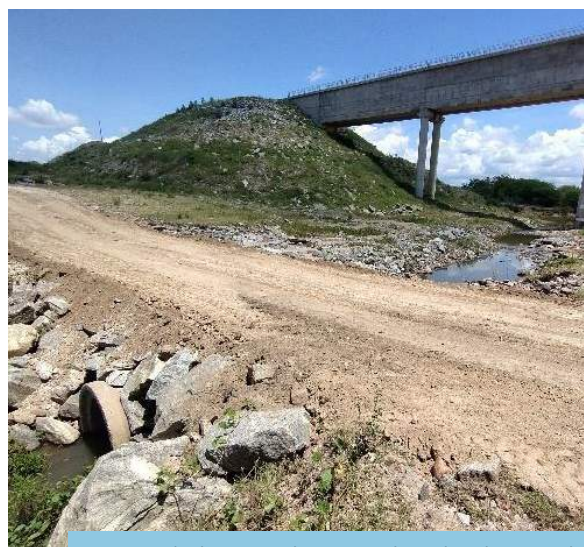
Sistema de drenagem (bueiro) implantado sobre estrada de serviço próximo ao aqueduto Jacaré (WBS 2305), Trecho V, Eixo Leste do PISF.