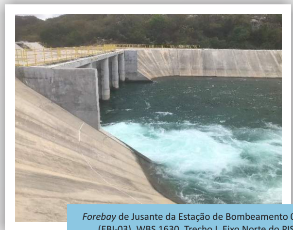
Forebay de Jusante da Estação de Bombeamento 03 (EBI-03), WBS 1630, Trecho I, Eixo Norte do PISF.