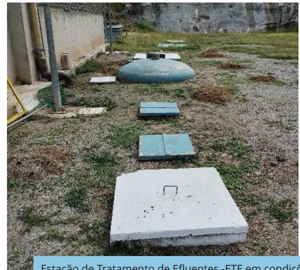
Estação de Tratamento de Efluentes -ETE em condições adequadas de funcionamento, na Estação de Bombeamento - EBV-1, Trecho V, Eixo Leste do PISF.