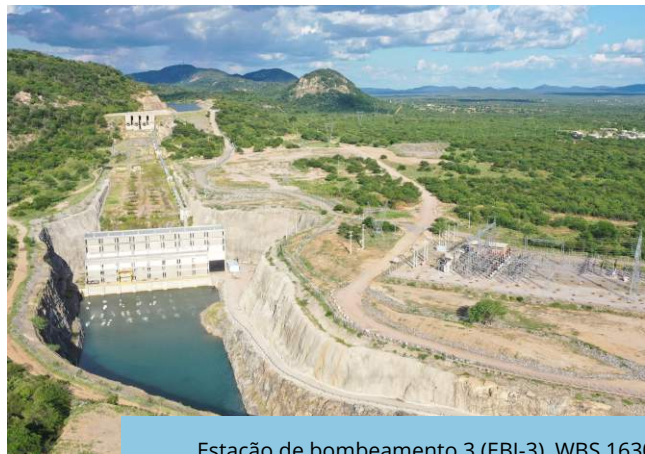
Estação de bombeamento 3 (EBI-3), WBS 1630, Trecho I, Eixo Norte do PISF (Salgueiro/PE).

Operadoras (Execução) Consórcio Gestor Ambiental (Acompanhamento)