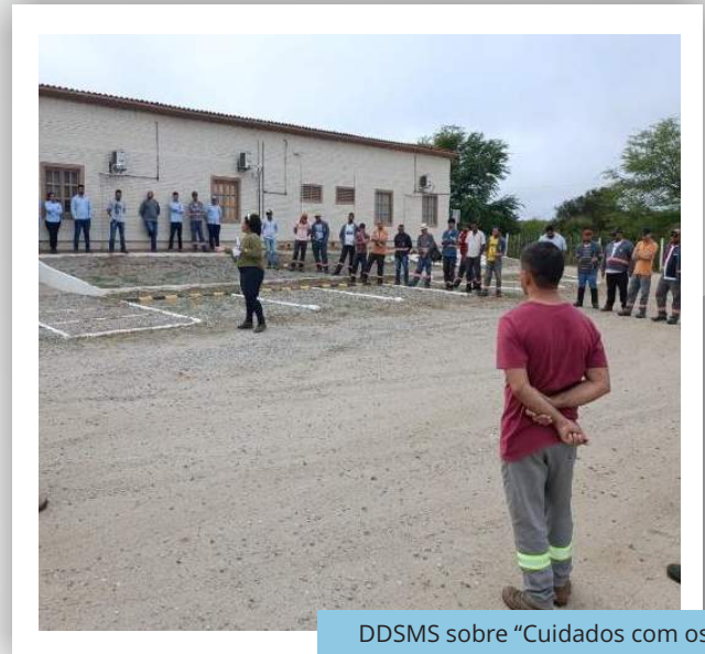
DDSMS sobre “Cuidados com os EPIs”, no canteiro de Sertânia/PE.

Operadoras (Execução) Consórcio Gestor Ambiental (Acompanhamento)