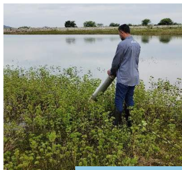
Coleta ativa de insetos adultos, utilizando o aspirador entomológico elétrico, no reservatório Muquém (Eixo Leste).