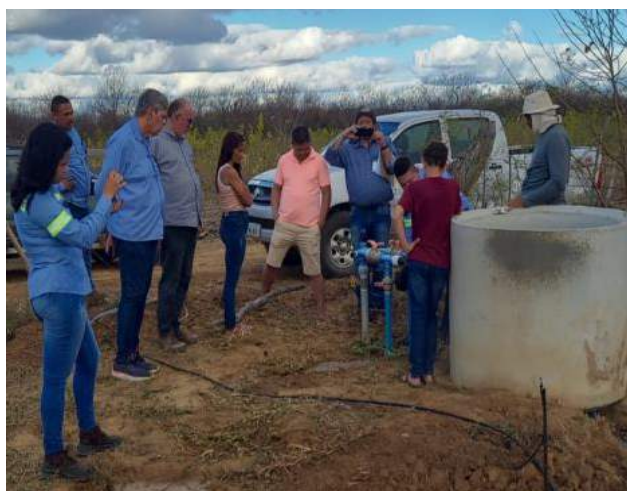
Acompanhamento dos testes e comissionamento do sistema de irrigação da VPR Retiro.