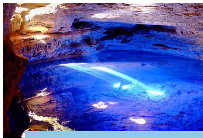
Parque Nacional (PARNA) da Chapada Diamantina - BA, beneficiado com aplicação de recursos oriundos da compensação ambiental do PISF.