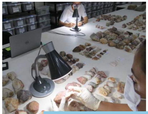
Procedimento de análise de material arqueológico/laboratório Fumdhham.