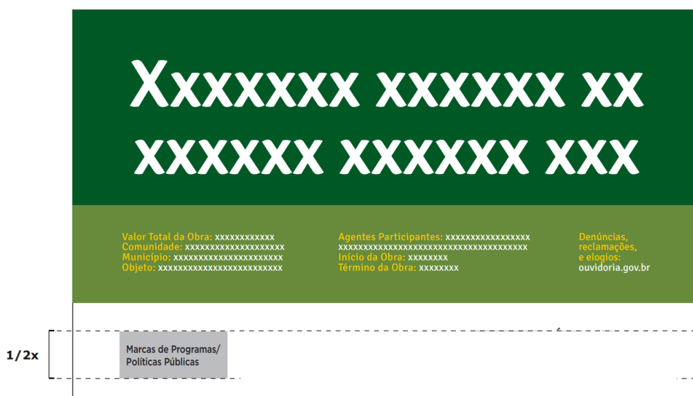
Figura 1. Exemplo genérico de placa de obra

A placa de obra exigida pelo Agente Operador do Pró-Cidades (ver Manual de Fomento – Programa Pró-Cidades, Caixa Econômica Federal) deverá seguir os padrões orientados pela Secretaria de Comunicação do Governo Federal no Manual de Uso da Marca do Governo Federal – Obras. A Figura 1 exemplifica uma placa genérica, à título de exemplo.