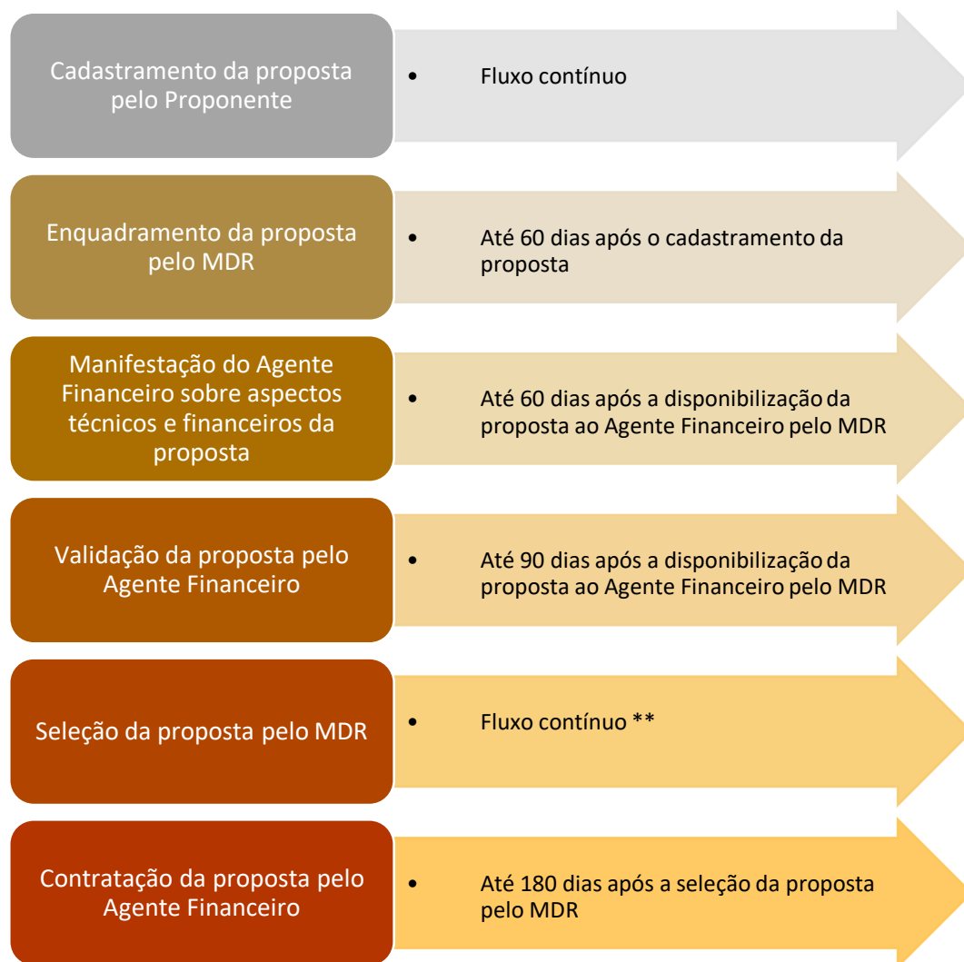
Quadro 1. Etapas e prazos.

* Os prazos previstos poderão ser prorrogados a critério do MDR e do Agente Financeiro.