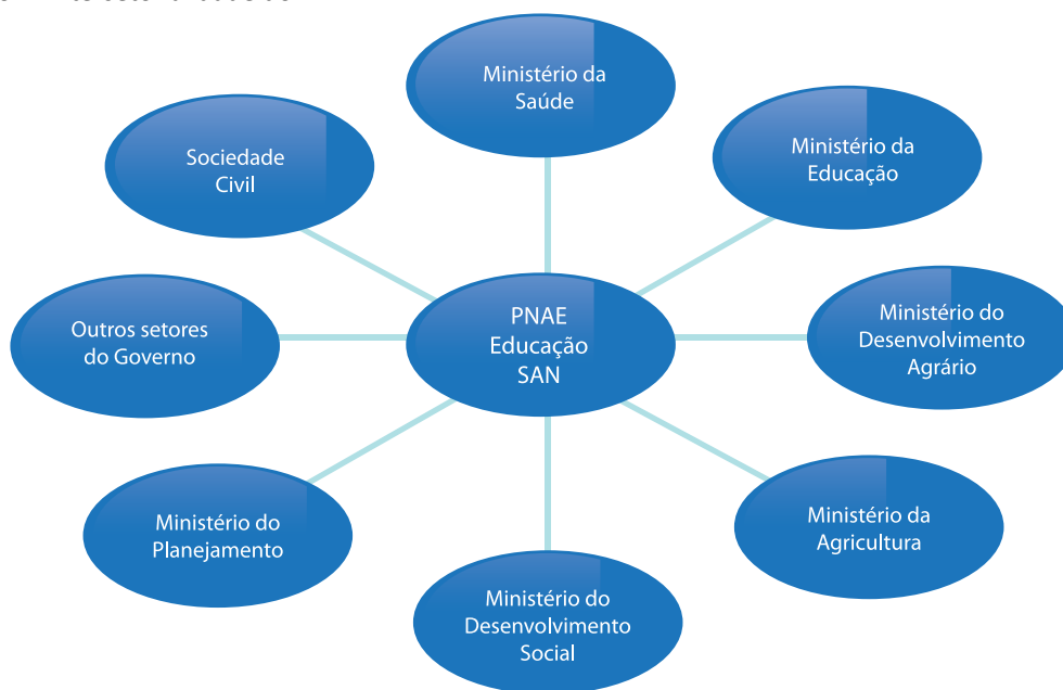
Gráfico 2: Intersetorialidade do PNAE

Agrário, do Planejamento e Fazenda, do Desenvolvimento Social, da Agricultura, entre outros setores) e a sociedade civil, por meio do Conselho Nacional de Segurança Alimentar e Nutricional – CONSEA.