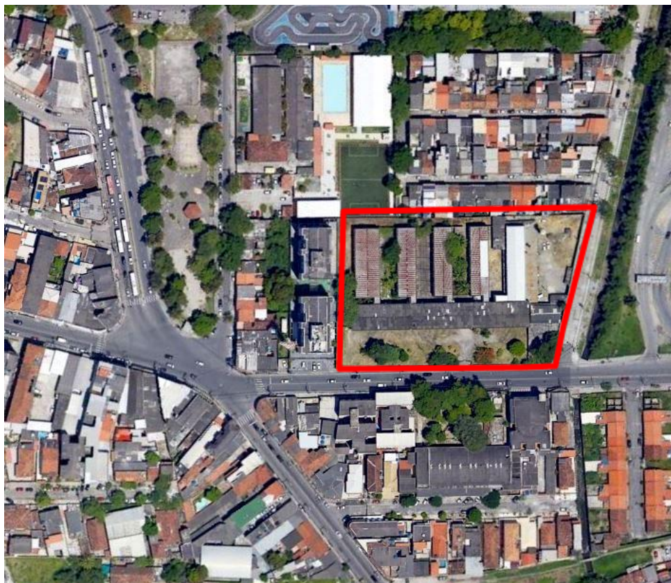
Figura 1: Imagem de satélite - Localização do terreno em Niterói.

O terreno se situa em área urbanizada do município de Niterói. Faz divisa de fundos com edificações residenciais e, em uma das laterais, com a Fundação para a Infância e Adolescência (FIA), órgão da Administração Estadual. Um conjunto de 5 prédios, com térreo e primeiro pavimento, deverão ser demolidos, conforme o Material Técnico para possibilitar a construção da Unidade Socioeducativa. As implicações decorrentes das atividades de demolição e da obra, em si, deverão ser consideradas cuidadosamente pela SUPERVISORA.