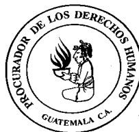
Procuraduría de los Derechos Humanos de Guatemala