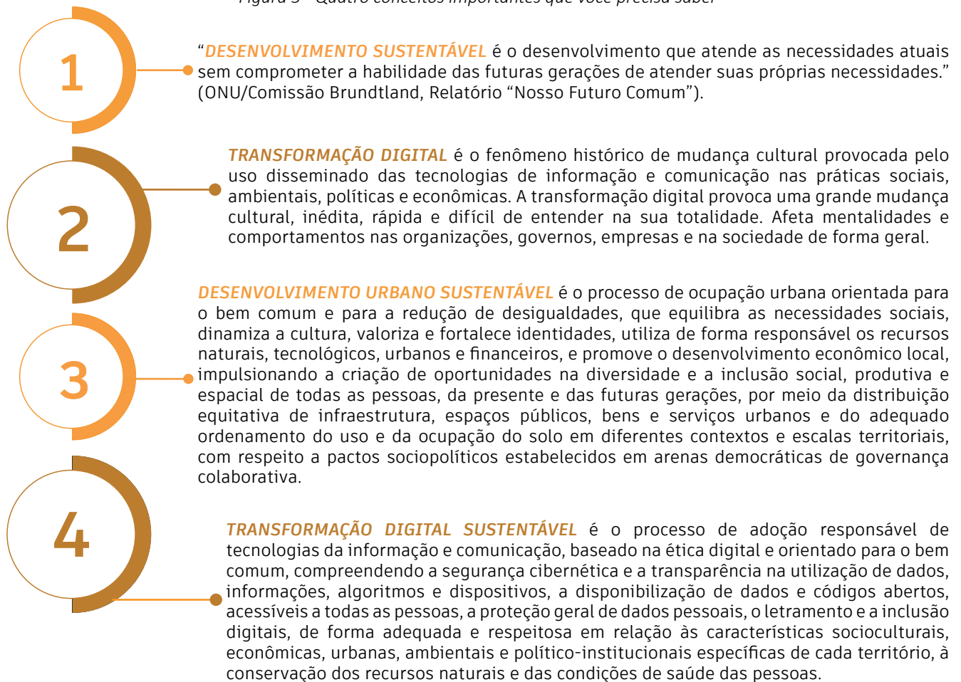
Figura 3 - Quatro conceitos importantes que você precisa saber

Essas são as visões que a Carta assume para apresentar ao país uma agenda brasileira para cidades inteligentes. A transformação digital pode gerar impactos positivos ou desafios, dependendo do contexto. A realidade de cada lugar também influencia no potencial de uso das tecnologias da informação e comunicação. É preciso, portanto, considerar a ampla diversidade e as profundas desigualdades históricas que marcam nosso território ao refletir e agir sobre a transformação digital. Só assim será possível que a transformação digital nas cidades brasileiras seja positiva e sustentável.