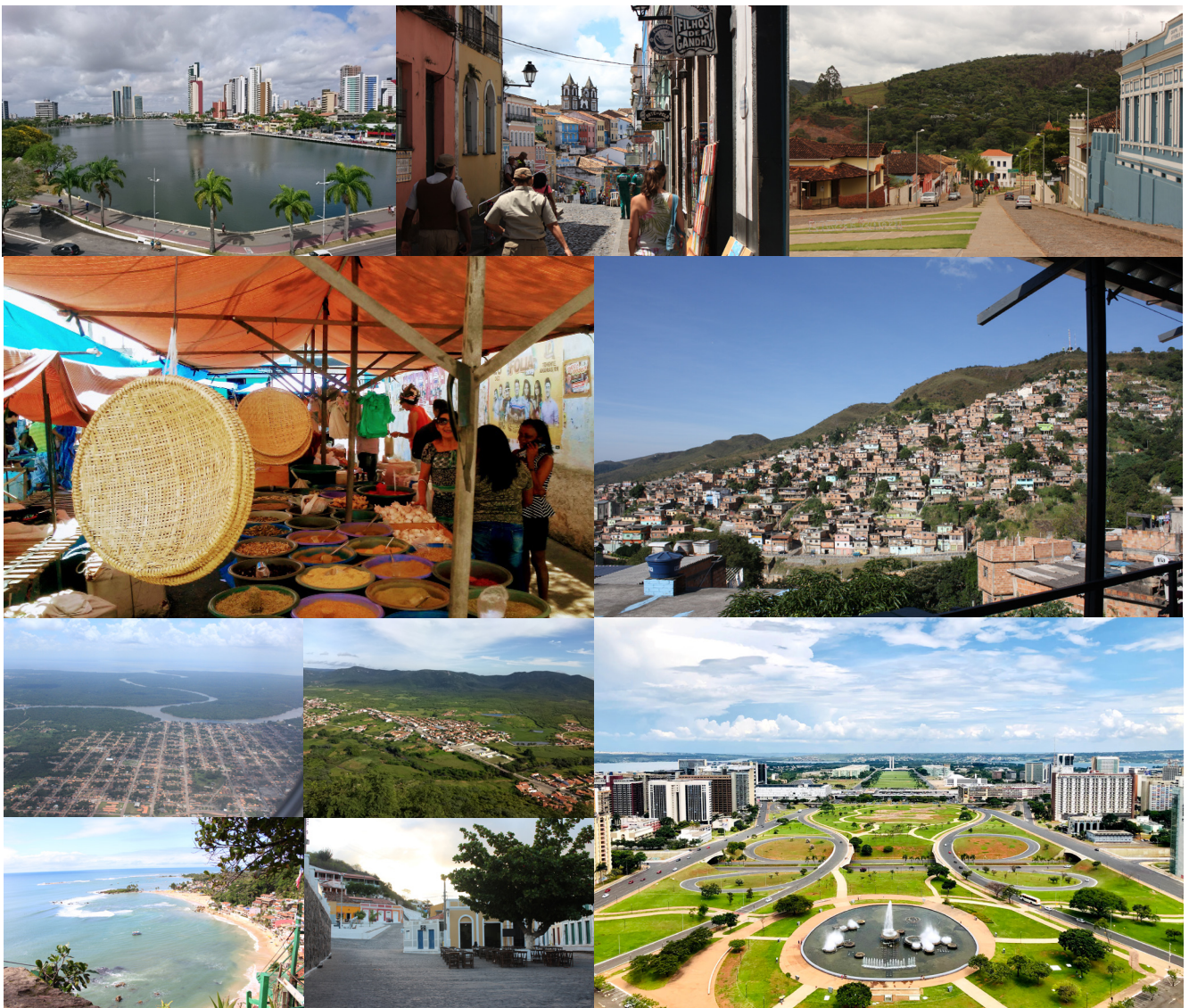
A cidade brasileira em seus diferentes contextos.

Esta versão resumida apresenta as principais ideias contidas na Carta . Recomenda-se a leitura do documento na íntegra para quem tem interesse em aprofundar-se sobre o conteúdo.