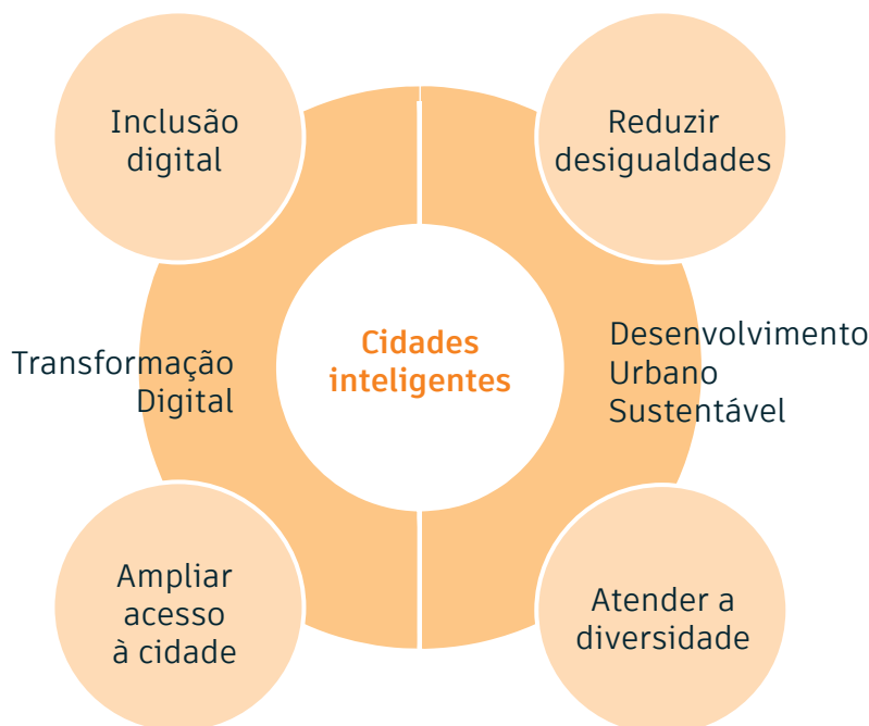
Figura 2 - Motivos que levaram a elaborar a Carta Brasileira para Cidades Inteligentes

“Não deixar ninguém para trás” é o lema da Agenda 2030 para o Desenvolvimento Sustentável. A Nova Agenda Urbana (NAU) assumiu o mesmo lema para ações em cidades e assentamentos urbanos. Ambas são acordos internacionais. Os países que assinam acordos se comprometem a implementar as decisões, respeitando as realidades nacionais. Quando o Brasil assinou a NAU, prometeu que adotaria uma abordagem de cidade inteligente. A Carta é uma ação concreta nesse sentido.