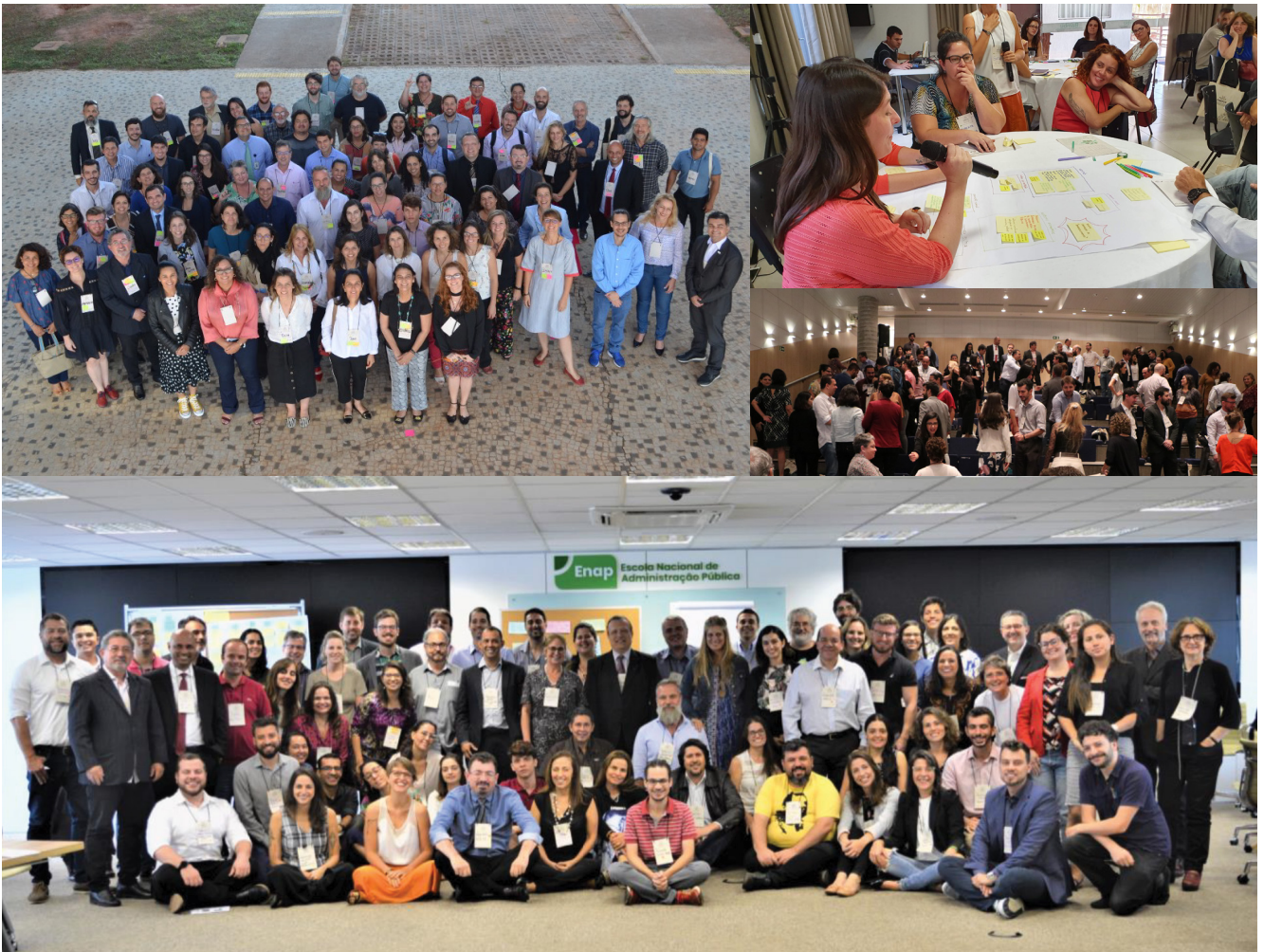
A Comunidade da Carta Brasileira para Cidades Inteligentes durante as oficinas.

Comunidade da Carta é uma rede aberta a todas as pessoas que quiserem participar a qualquer momento. É formada por pessoas e instituições com conhecimento técnico especializado em diversas áreas, bem como por organizações da sociedade civil.