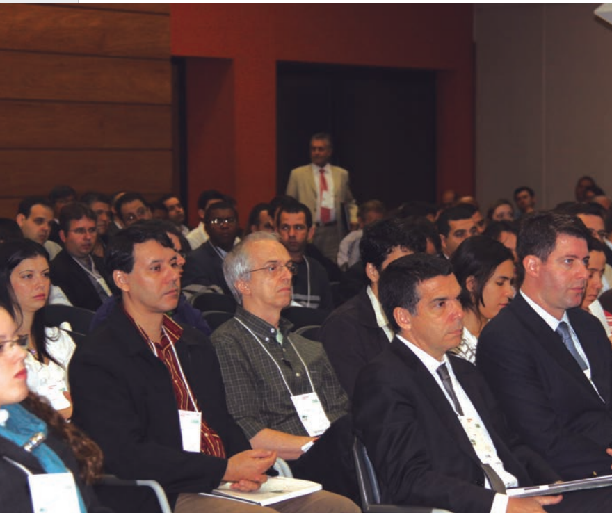
Público atento às apresentações do CertForum no Rio de Janeiro

eletrônico elimina a burocracia na tramitação, aumenta a acessibilidade, reduz custos e garante a interoperabilidade.”