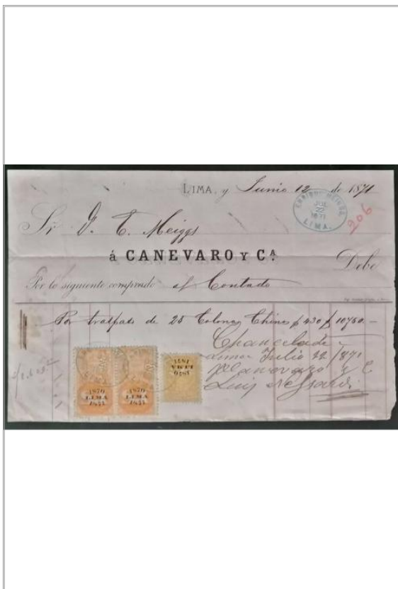
Imágen: Vista General