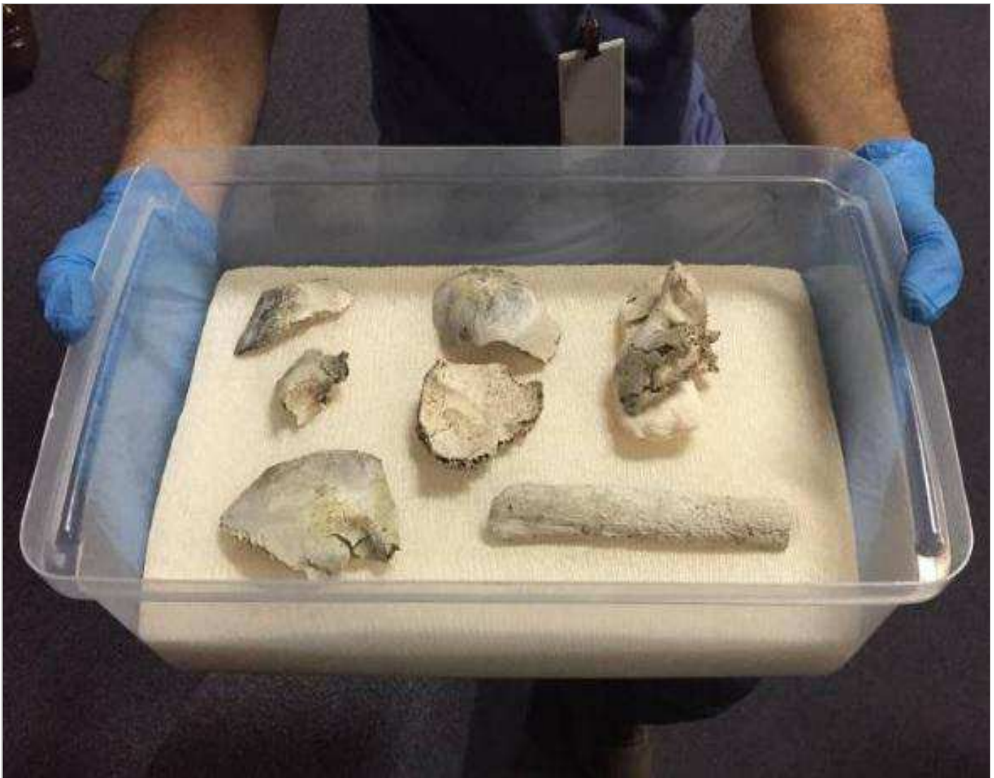
Alguns dos fragmentos encontrados da Luzia

Todavia, o fóssil mais antigo das Américas sofreu alterações decorrentes do calor do fogo, tendo sobrevivido 80% da ossada. Da coleção de invertebrados, que se esperava ter sido inteiramente consumida pelo incêndio, 12 mil pequenos itens sobreviveram.