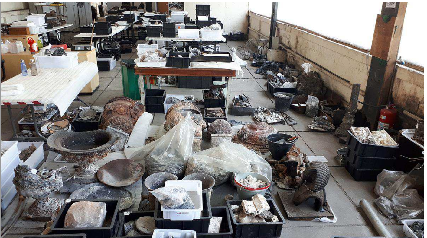
Salão onde muitos itens encontrados são colocados

Um das principais perdas do museu foi o arquivo em papel, que possuía documentos importantes de nossa história política e um acervo da memória do museu: os arquivos foram inteiros queimados. O Museu Nacional está, até hoje, em busca de arquivos que foram replicados em pesquisas anteriores ao incêndio.