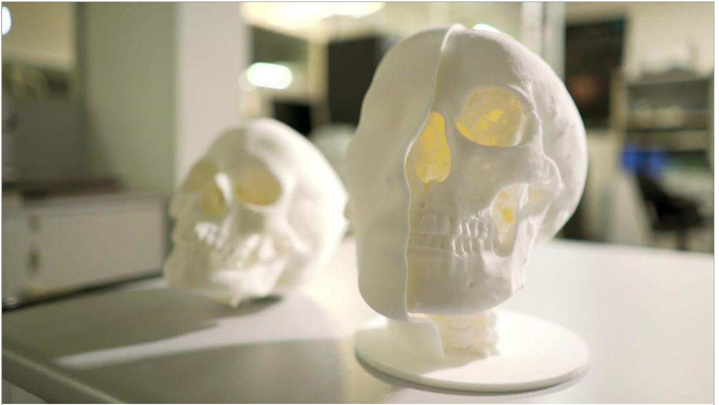
Reconstituição do crânio de Luzia