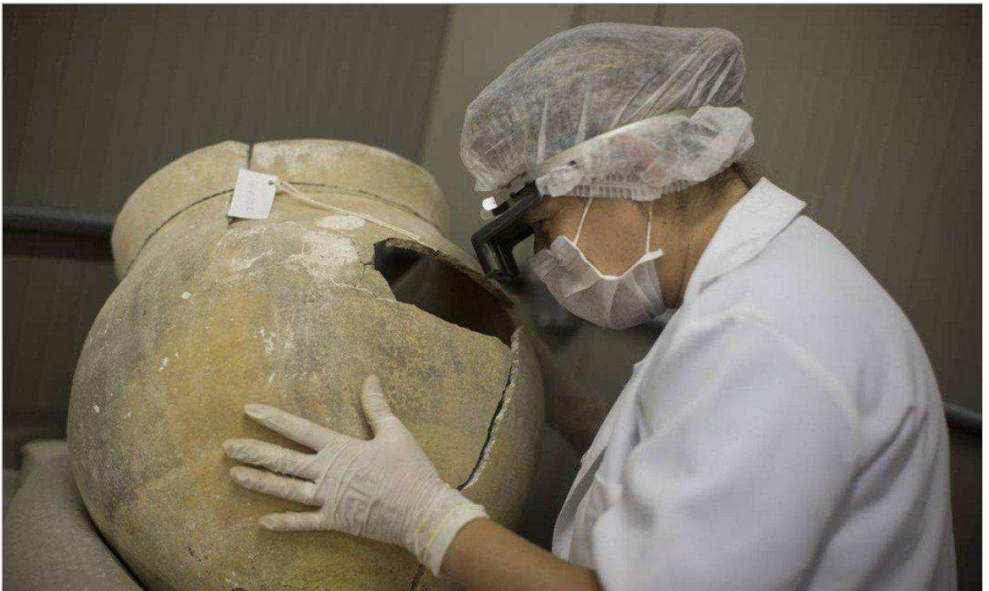
Cerâmica brasileira sendo analisada após recuperação