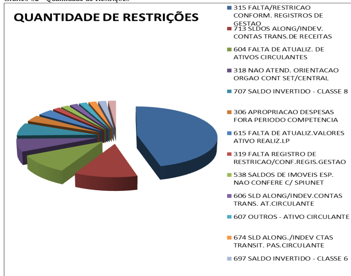
Gráfico 02 - Quantidade de Restrições