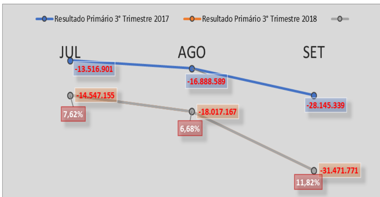
Gráfico 3 – Resultado do RGPS: Comparativo 3º Trimestre 2017/2018

Pelo lado da despesa o comportamento manteve estável com crescimento entre 5% e 6% nos meses do trimestre.