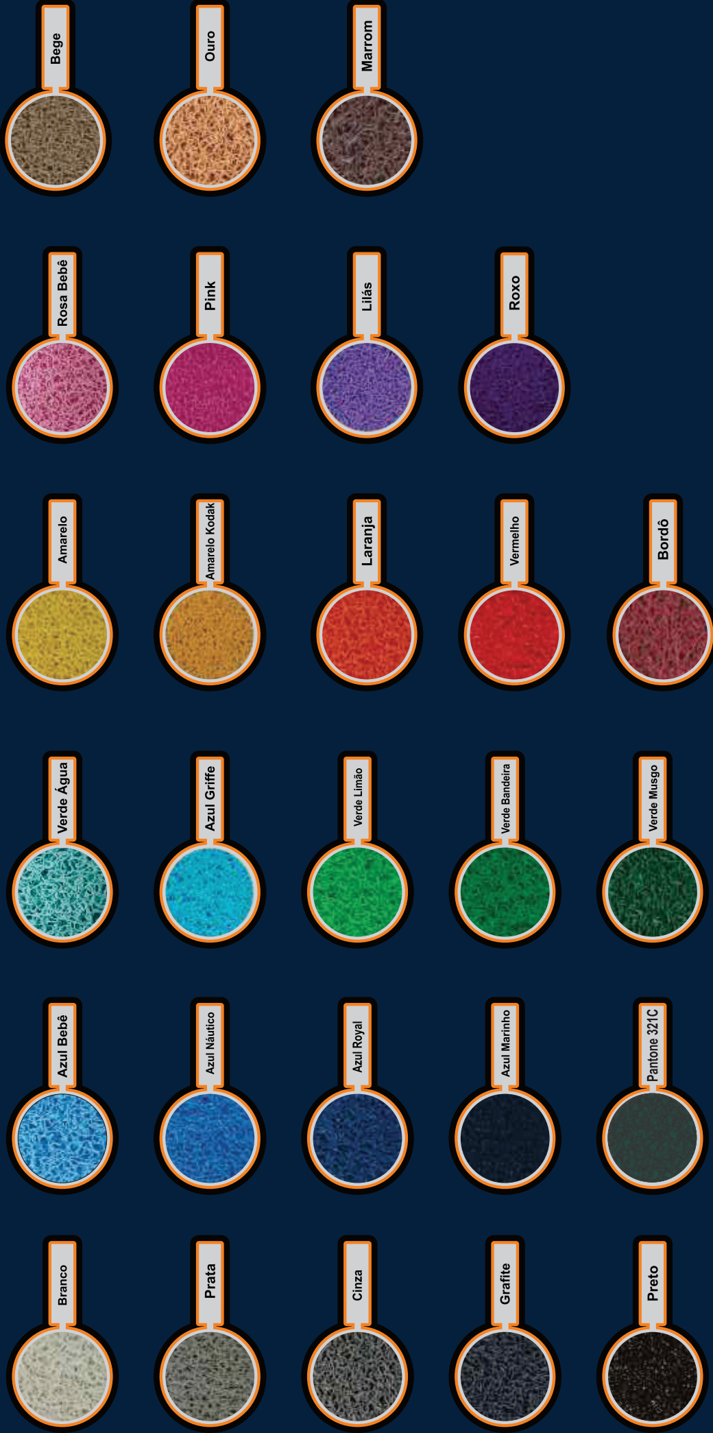
TABELA DE CORES