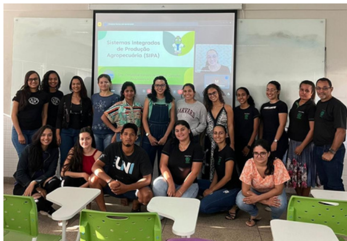
Alunos do 4º Período de Medicina Veterinária do Instituto Federal de Rondônia (IFRO).

No dia 30 de junho, o Instituto Nacional do Semiárido (INSA/MCTI) ministrou uma palestra para alunos do 4º Período de Medicina Veterinária do Instituto Federal de Rondônia (IFRO), Campus Jaru.