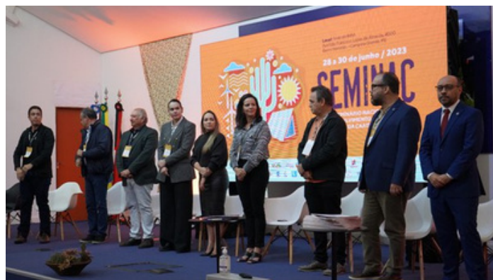
A mesa de autoridades da abertura do 1º SEMINAC foi composta por representantes das principais instituições parceiras atuantes em prol da Caatinga