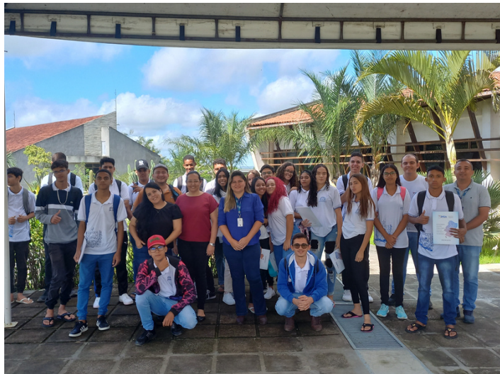
Turma de estudantes do ensino médio da EEEFM Tereza Alves de Moura.

A turma de estudantes do ensino médio da Escola Estadual de Ensino Fundamental e Médio Tereza Alves de Moura, localizada no município de Queimadas (PB), visitou na manhã do último dia 11 de julho, a sede do Instituto Nacional do Semiárido (INSA/MCTI).