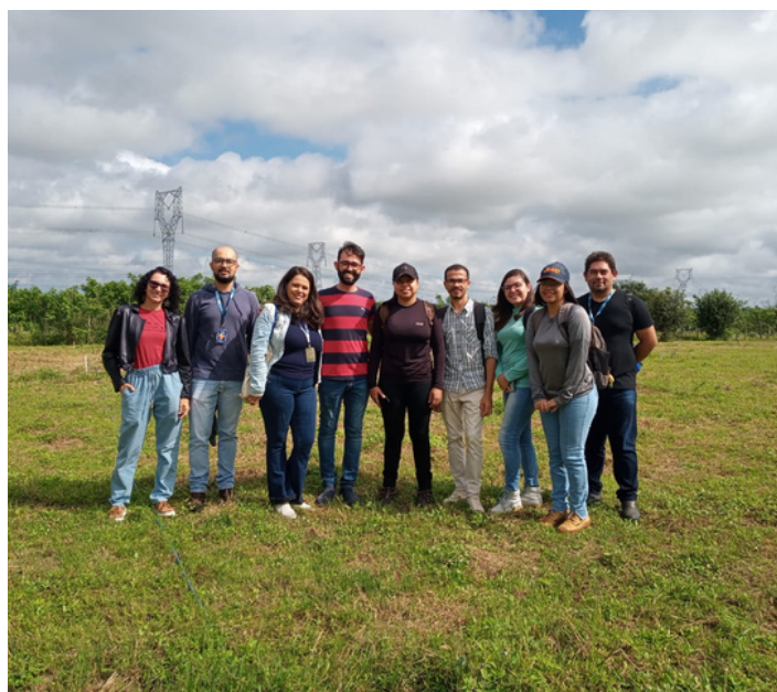
Turma de estudantes do ensino médio da EEEFM Tereza Alves de Moura.

O grupo foi apresentado aos projetos ligados ao Saneamento Ambiental e Reuso de Água (SARA), Melhoramento de Palma e Laboratório de Cultivo in vitro, além das estufas que abrigam a coleção científica do Cactário Guimarães Duque e o Viveiro de Mudas.