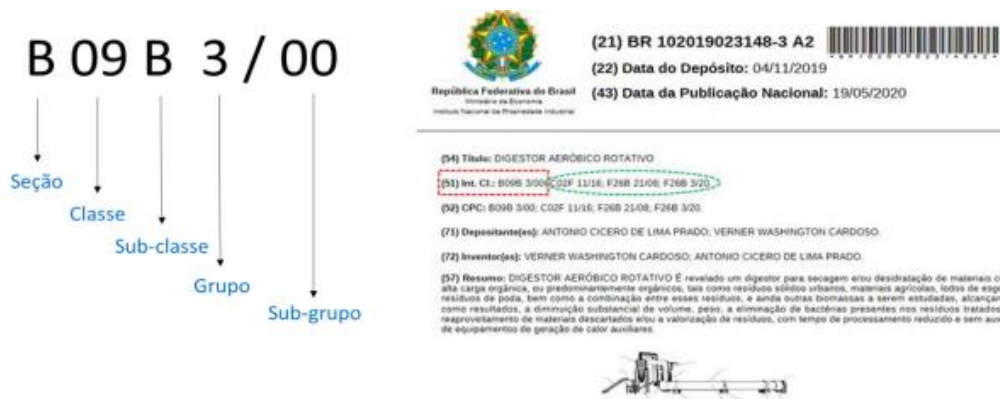
Figura 2- Exemplo de Classificação Internacional de Patente

Utilizando como exemplo a Figura 1, o folheto de publicação, que o pedido de patente BR 102019023148-3 A2, possui 4 classificações. A classificação B09B 3/00 é chamada de classificação principal e as demais de classificações secundárias. As classificações F26B 21/08 e F26B 3/20 (em destaque no folheto de publicação), também são consideradas classificações secundárias. Portanto, ao se utilizar a IPC, é necessário saber que a matéria técnica de uma invenção, não tem limites estabelecidos e que um invento pode receber mais de uma classificação ou tantas quantas forem necessárias. Não havendo local específico para tal invento, previsto na IPC, é utilizado o que for mais apropriado