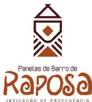
Figura 02 - Representação gráfica da IG a ser aplicada para os padrões de comercialização da painela de barro.

A representação gráfica e figurativa da Indicação de Procedência “RAPOSA” para a Painela de Barro, com distintivo gráfico do tipo misto, de titularidade dos artesãos estabelecidos no território delimitado e coordenada pelo Conselho Regulador da Associação das Produtoras Indígenas Artesanal de Painela de Barro da Comunidade Raposa 1 – MAIKAN YERIN está assim definida: