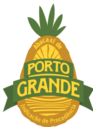
Figura 02 - Representação gráfica da IG a ser aplicada para os padrões de comercialização do abacaxi.

A representação gráfica e figurativa da Indicação de Procedência “PORTO GRANDE” para o Abacaxi, com distintivo gráfico do tipo misto, de titularidade dos produtores estabelecidos no território delimitado e coordenada pelo Conselho Regulador da Associação dos Produtores de Abacaxi de Porto Grande está assim definida: