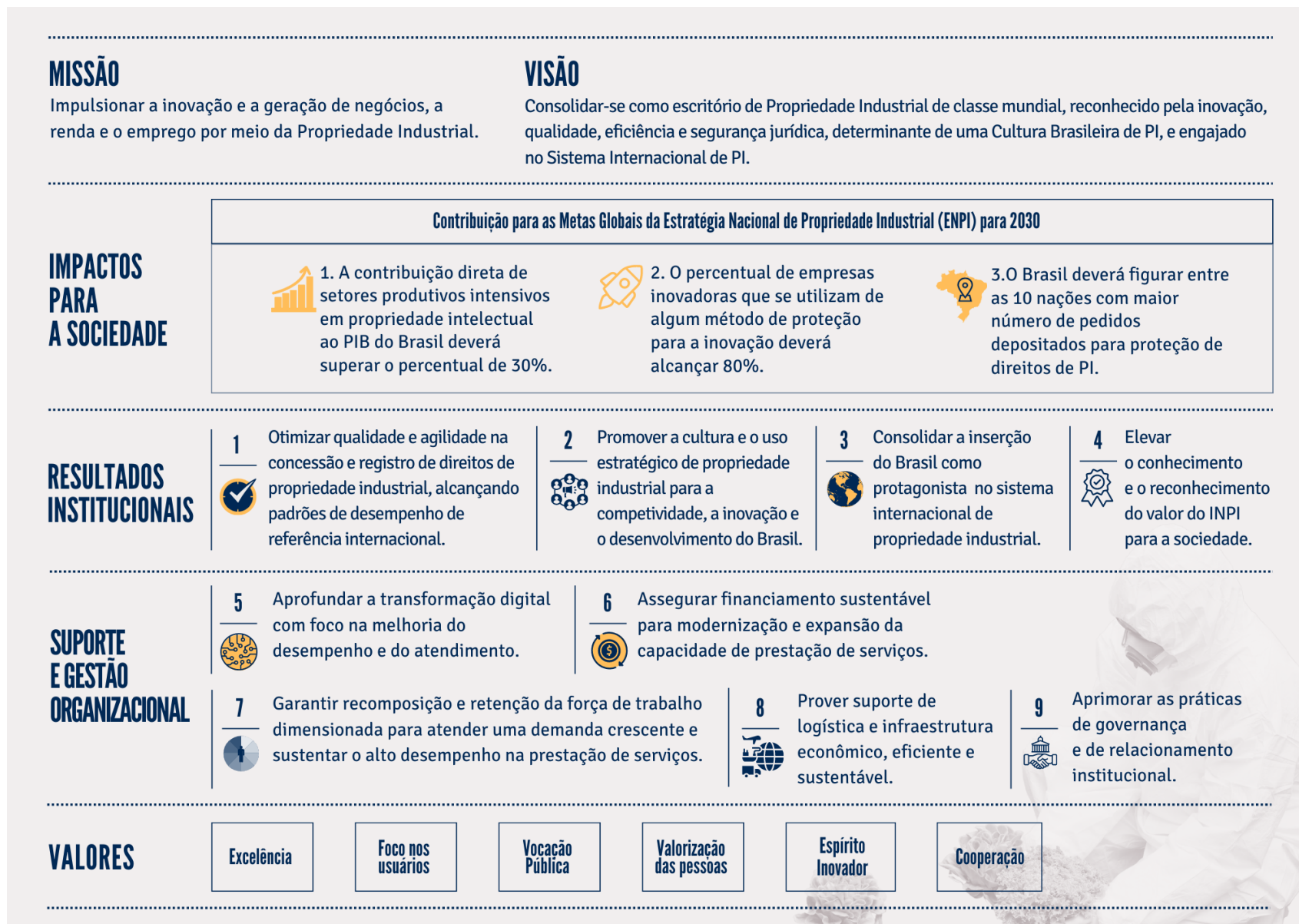
Figura 1 – Mapa Estratégico do INPI