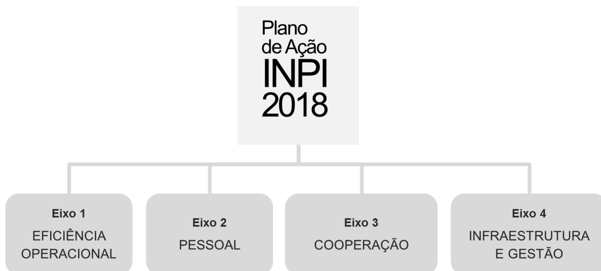
Figura 2: Eixos do Plano de Ação para 2018

A seguir, são apresentadas as iniciativas institucionais e os respectivos produtos, prazos e unidades responsáveis. Parte das iniciativas institucionais possui horizonte plurianual de execução. Os produtos das iniciativas definem as entregas previstas para 2018.